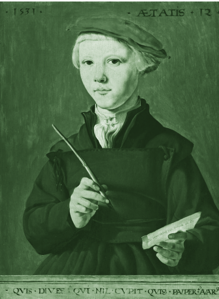
3 Maarten van Heemskerck, Portret van een jonge scholier , 1531. Olieverf op paneel, 46,5 x 35 cm. Museum Boijmans Van Beuningen, Rotterdam (ok 1797).

genomen niet: psalmzingen bleef belangrijk, naast lezen en schrijven, en voor de hogere klassen Latijn, inclusief grammatica en schrijfcompositie (retorica). De nadruk lag op religieuze thema's. 5 Het onderwijs was ook lang niet voor iedereen weggelegd, want van de meeste burgers werd niet verwacht dat ze moesten kunnen lezen en schrijven. Zeker voor meisjes werd dit niet noodzakelijk geacht.