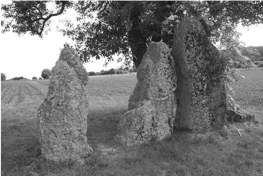
De menhirs in het Henegouwse Oppagne hadden in de prehistorie vermoedelijk een religieuze betekenis voor de lokale boerengemeenschap.

De hunebedden en menhirs staan bovendien ook niet op zichzelf. Ook in andere delen van Europa ontstonden enorme stenen monumenten. Stonehenge in Engeland is daarvan het bekendste voorbeeld. In Zwolle zijn restanten gevonden van een houten bouwwerk dat duidelijke overeenkomsten vertoont met Stonehenge. Deze stenen (of houten) monumenten zijn bedoeld als een heilige kalender. Door de stand van de stenen kunnen de kortste en de langste dag van het jaar nauwkeurig worden gemeten. Hieruit kan men voorzichtig afleiden dat de hunebedbouwers een godsdienst beleden waarin de stand van de hemellichamen en de zon een belangrijke rol speelden.