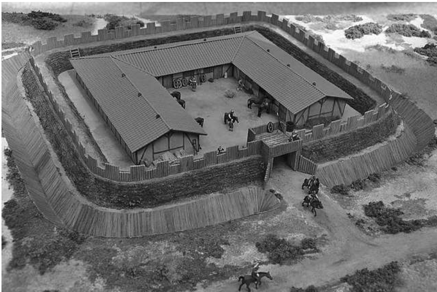
Tekening van een Romeins legerkamp zoals dat in de tijd van Caesar en Augustus bestond in het huidige Nederland en België.