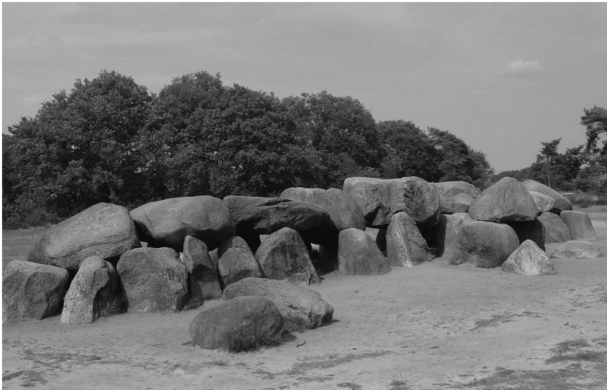
De hunebedden in Drenthe zijn een van de bekendste Nederlandse voorbeelden van prehistorische stenen bouwwerken die door de eerste landbouwculturen werden opgetrokken.

Het is zeker dat de prehistorische jagers- en verzamelaars niet alleen het land, maar ook de rivieren en de open zee gebruikten om in hun voedselbehoefte te voorzien. De oudste kano van de wereld, de kano van Pesse, is in Nederland gevonden en dateert van ongeveer 7900 v. Chr. Deze kano werd in de kern gevormd door een uitgeholde boomstam van meer dan drie meter waarin meerdere personen tegelijkertijd het water op konden. Een prehistorisch graf dat in de omgeving van Hardinxveld-Giessendam werd gevonden verteld ons meer over deze periode. Een vrouw van tussen de veertig en zestig jaar ligt hier begraven. Haar woongemeenschap had haar voedsel meegegeven waaruit kan worden afgeleid dat deze prehistorische mevrouw aan de veilige kant van de zandduin leefde. Haar gemeenschap gebruikte kano's om op snoek te vissen in de rivieren. In haar graf werden tevens resten gevonden van vuurstenen pijlen waarmee op vogels werd geschoten, en van fruit en noten uit het wild. Het graf wordt gedateerd op ongeveer 5500 v. Chr. Uit deze periode zijn ook talrijke vuurstenen bijlen en pijlpunten gevonden die ons veel vertellen over de gereedschappen van de prehistorische mens.