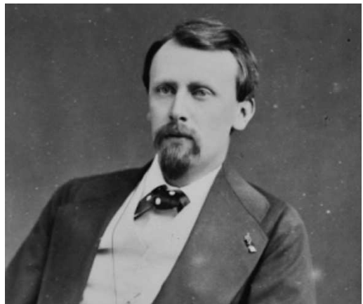
Willem Nicolaas, 'Wiwill', Prins van Oranje