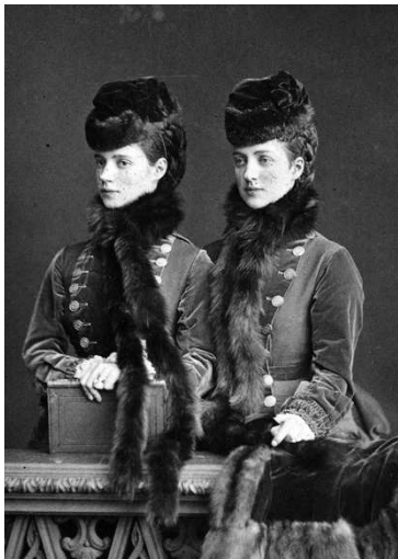
Twee Deense prinsessen: Dagmar trouwde met Alexander Romanov en werd als Maria Feodorovna tsarina van Rusland; haar zus Ova trouwde met de latere koning Eduard VII en werd koningin van Engeland.

Die verbintenissen tussen de verschillende vorstenhuizen hadden in Europa geleid tot een sterke band tussen verschillende landen. Die band werd in de loop van de 19 e eeuw alleen maar sterker.