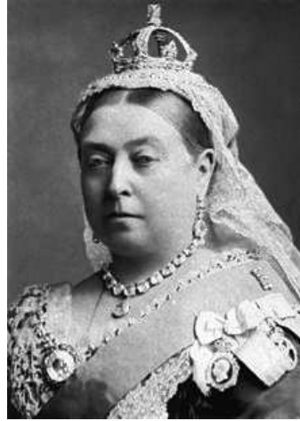
Koningin Victoria

Diplomaten begaven zich op weg met een portret van de mogelijke huwelijkskandidaat. Soms ook werden de prinsen zelf Europa ingestuurd voor een 'bruidsschouw'; ze trokken langs bevriende hoven om de jonge prinsessen te keuren. Als het kon werd er een ongedwongen ontmoeting gearrangeerd tijdens een feestelijke bijeenkomst zoals een huwelijk van verwanten of tijdens een kuur in een van de vele Europese kuuroorden zoals Spa, Bad Ems, Aix-les-Bains of Karlsbad waar leden van de Europese adel een deel van de zomer doorbrachten. Als de beoogde kandidaat in de smaak viel werd er vaak maandenlang onderhandeld over de huwelijksvoorwaarden, vooral de hoogte van de bruidsschat was belangrijk, het ging daarbij om enorme bedragen. De jongelieden om wie het allemaal ging hadden soms wel iets maar vaker niets in te brengen. Het kwam voor dat een prinses een voorgestelde huwelijkskandidaat weigerde omdat hij te oud of te lelijk was of omdat ze niet van geloof wilde veranderen of ertegenop zag om te moeten verhuizen naar een ver, onbekend land. Maar dan werd door haar ouders een enorme druk uitgeoefend op de jonge prinses om toch maar met de voorgestelde kandidaat in zee te gaan, het ging immers om het belang van haarzelf, de familie en het belang van het land.