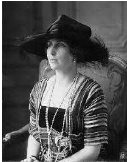
Prinses Victoria, 'Ena' in de familie, draagster van het hemofilie-gen

daarbij hielp was dat iedereen Frans sprak. Frans was de taal van de diplomatie en ook die van de vorstelijke hoven. Al heel jong kregen de prinsjes en prinsesjes les in Frans van een huisleraar of gouvernante. Aandoenlijk is het om hun brieven te lezen die in enkele gevallen later werden gepubliceerd. Hun Frans bestaat uit eenvoudige zinnen en zit vol met grappige fouten. Maar een bezoek aan het Russische hof in Sint-Petersburg of het Zweedse hof in Stockholm leverde geen direct communicatieproblemen op, iedereen sprak dezelfde taal: schoolfrans. Bovendien golden in heel Europa ongeveer dezelfde beleefdheidsvormen. Deze