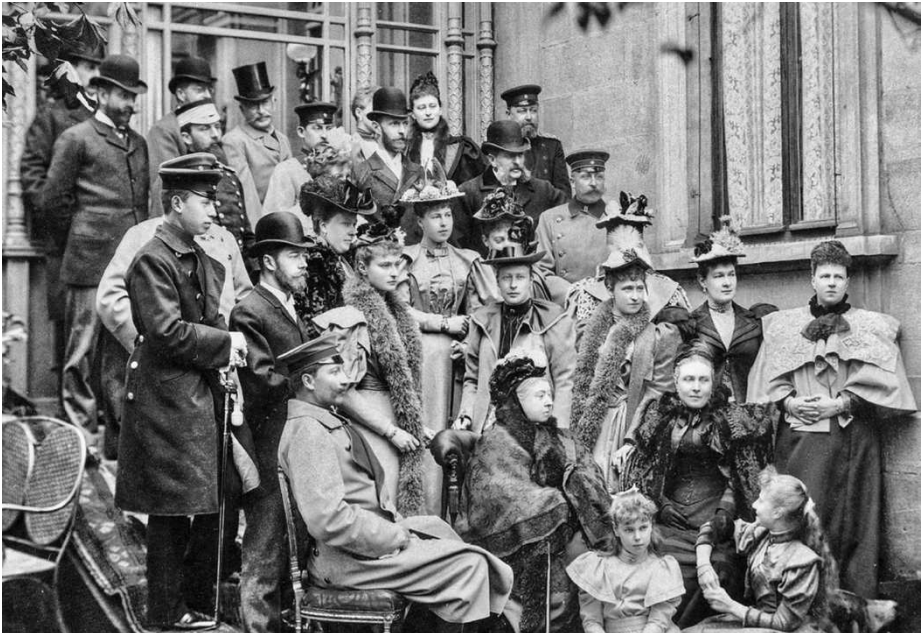
1894. Kinderen en kleinkinderen van koning Victoria in Coburg op de wat groezelige binnenplaats van het kasteel bij de verloving van de latere tsaar Nicolaas II met prinses Alix van Hessen.

Het hertogdom Saksen-Coburg-Gotha had door een verstandige huwelijks-politiek en goede contacten verbindingen gekregen met koninklijke families in heel Europa en daarmee ervoor gezorgd dat de naam van het onbeduidende landje overal bekend was. Prins Albert trouwde in 1840 met kroonprinses Victoria. Het Britse koningshuis heette tot 1917 officieel Saksen-Coburg-Gotha. Koning George V veranderde tijdens de Eerste Wereldoorlog deze te Duitse naam in Windsor .