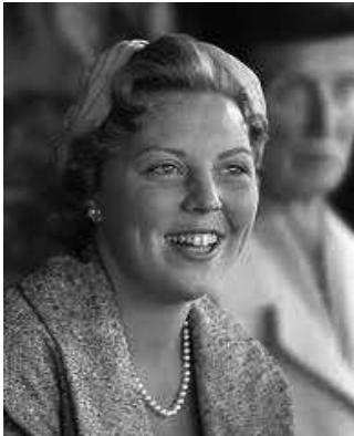
Prinses Beatrix, jaren zestig

Het was ergens aan een gracht in Amsterdam, de prinses werd vergezeld door een secretaresse en een medewerker. Ik was onder de indruk van Beatrix, van haar bevlogenheid, haar verzorgde uiterlijk en haar keurige, wat bekakte Nederlands. Ik zat aan tafel met iemand met levenservaring met visie, iemand met klasse. Ik, met mijn Duitse achternaam, had het met haar te doen toen ze enkele jaren later werd bekritiseerd en aangevallen omdat ze het in haar hoofd had gehaald om te gaan trouwen met een Duitser.