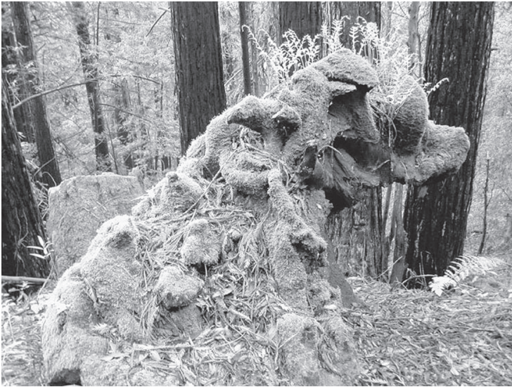
De hond van Jim, met dank aan James Clifford

balverslaggever op krukken, een gezondheids- en genetica-activist uit Fresno, wolven en honden in Syrië en de Franse Alpen, Chicken Little en 'Bushkluijjes' in Moldavië, tseetseevliegen en cavia's c in een Zimbabwaans laboratorium in een young-adultroman, wilde katten, camera dragende walvissen, misdadigers en honden die trainen in de gevangenis, en een getalenteerde hond en een vrouw van middelbare leeftijd die samen sporten in Californië. Dit zijn allemaal figuren, allemaal heel gewoon, hier en nu, op deze aardkloot, die vragen wie 'wij' zullen worden wanneer soorten kennismaken.