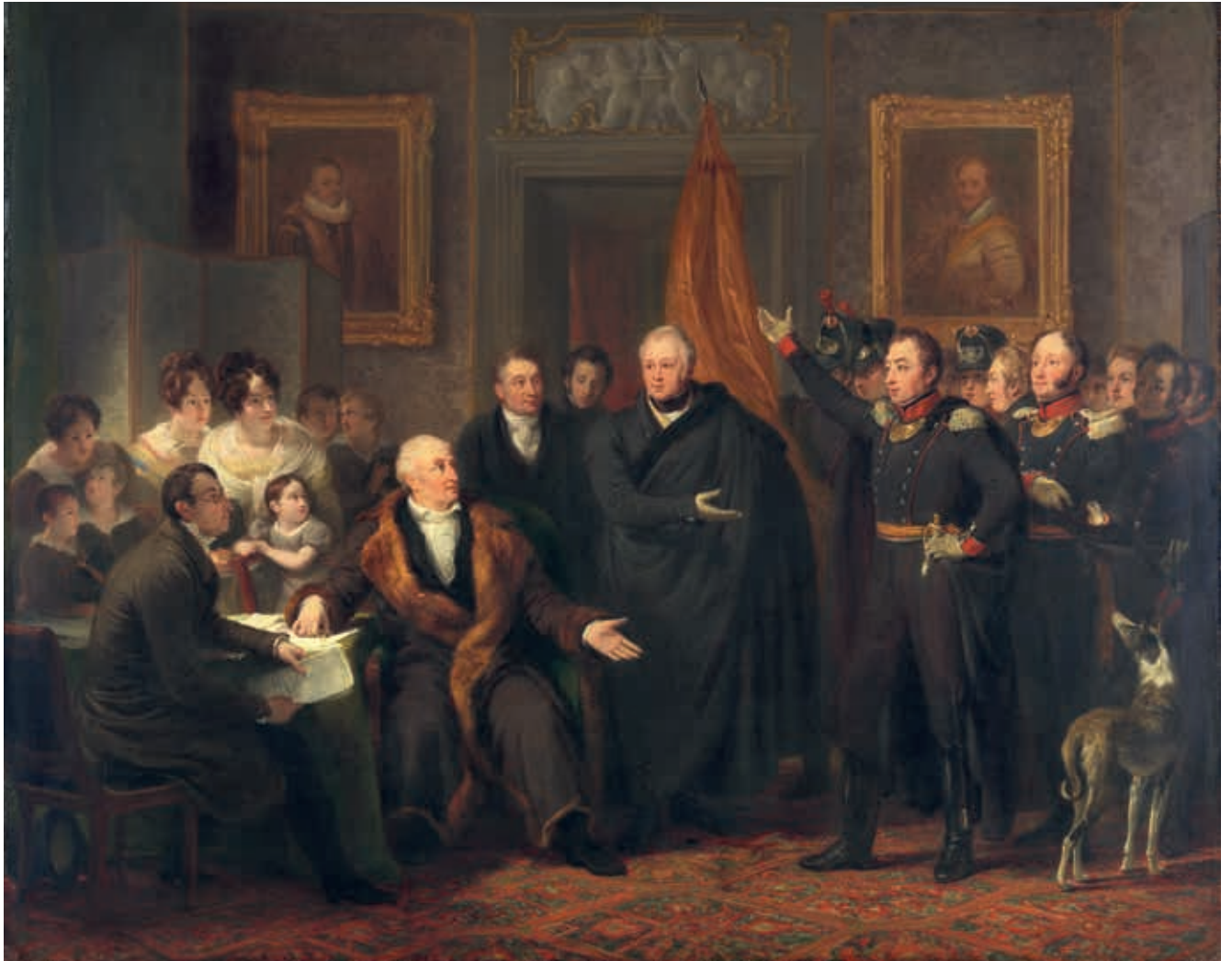
De aanvaarding van het Hoog Bewind door het Driemanschap in naam van de prins van Oranje, 21 november 1813. Schilderij van Jan Willem Pieneman. (Rijksmuseum, Amsterdam)