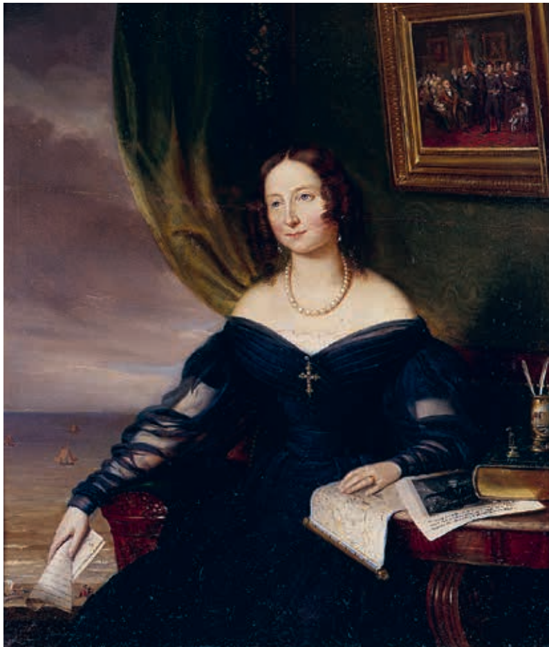
Portret van prinses Anna Paulowna, vervaardigd door Jean-Baptiste Van der Hulst (1790-1862). Boven de deurlijst hangt een kopie van het schilderij waarin het driemanschap in november 1813 het gezag van de prins van Oranje uitroept.

geval bijna vijftien jaar verstreken sinds de scène zich heeft afgespeeld. De schilder dient in 1828 dus zijn verbeelding te gebruiken om de gezichten van de afgebeelde personen vijftien jaar jonger te maken, maar slaagt daar slechts ten dele in. In november 1813 zijn Karel van Hogendorp, Frans Adam van der Duyn van Maasdam en Leopold graaf van Limburg Stirum respectievelijk 51, 42 en 55 jaar oud: mannen van middelbare leeftijd, met groot gezag. Vijftien jaar later zijn ze waardige grijsaards geworden en stralen ze niet meer zoveel daadkracht uit, dat het aannemelijk is dat ze het vaderland kunnen redden. Bovendien tonen de kleding en de kapsels de mode van 1828 en niet die van 1813.