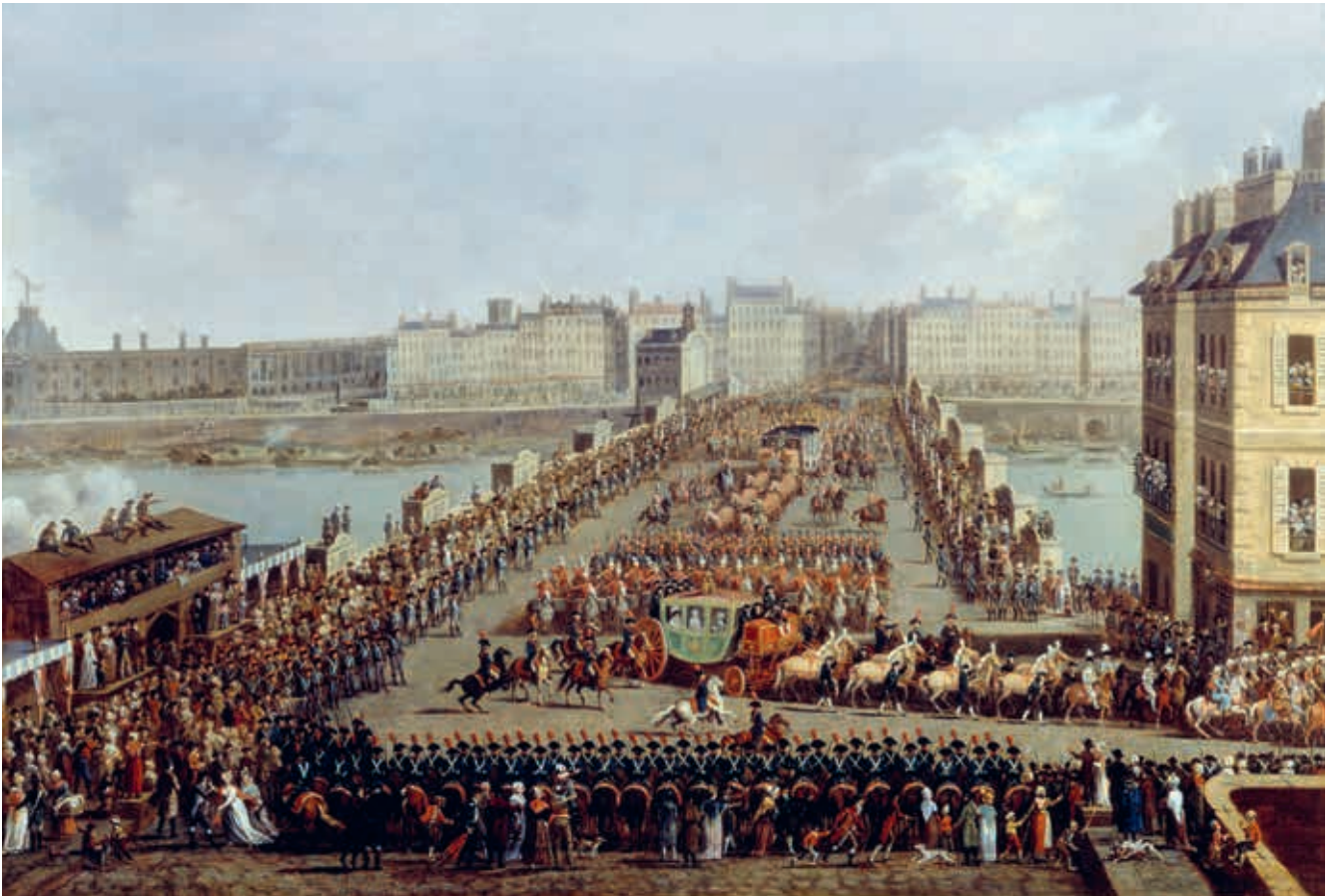
Napoleon op 2 december 1804 op de Pont Neuf in Parijs, in een militaire ambiance op weg naar de keizerskroning in de Notre-Dame. Schilderij van Jacques Bertaux (1745-1818). (Musée Carnavalet, Parijs)

De vergelijking met de keizerskroning – Sacre – van Napoleon op 2 december 1804 ligt gevoelig voor Willem, omdat hij zich wil presenteren als de vredelievende vorst die de bloeddorstige militair Napoleon opvolgt. De inhuldiging in Brussel mag dus vooral niet doen denken aan de keizerskroning van Napoleon. Daarvoor zijn de wonden nog veel te vers. Amper drie maanden geleden is Napoleon definitief verslagen, bij Waterloo, op luttele kilometers afstand van de plaats waar Willem zich laat inhuldigen. Napoleon legitimeerde zich in 1804 als degene die de soevereiniteit van Frankrijk op militaire wijze en met groot succes had verdedigd. Van de tocht van zijn paleis – de Tuilerieën in Parijs – naar de plaats van de kroning – de Notre Dame – maakte Napoleon een groots spektakel, veel meer dan Willem I dat doet bij zijn tocht door Brussel op weg naar de inhuldiging. Dat ligt niet zozeer aan het defilé van hoogwaardigheidsbekleders, ook