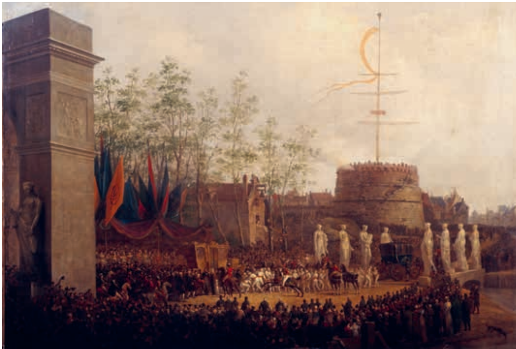
Aankomst van Willem I in Brussel, voordat hij er op 21 september 1815 zal worden gehuldigd als koning. In het midden biedt de burgemeester de sleutels van de stad aan. Aan de rechterzijde coördineert de opperstalmeester het uitspannen van de paarden, zodat in het wit geklede zakkendragers de koets de stad in kunnen trekken. Rechts staan acht kolossale beelden – personificaties van deugden – die speciaal voor deze gelegenheid zijn vervaardigd. Helemaal links op schilderij is een eveneens tijdelijke triomfboog zichtbaar. Later besluit Willem I om op deze plaats een permanente poort te bouwen, in neoclassistische stijl: de Willemspoort. Schilderij van Mattheus-Ignatius Van Bree (1773-1839).

is de elite, voor zover die van middelbare leeftijd of ouder is, vertrouwd met het stadhouderlijke hof. Zolang de representatie van Willem I op hetzelfde niveau ligt als, of iets boven dat van zijn vader, stadhouder Willem V, komt die vertrouwd over. De oudere elite in de zuidelijke provincies heeft evenwel nog een actieve herinnering aan het hof van Maria Christina van Oostenrijk en haar echtgenoot Albert van Saksen-Teschen, de gouverneurs van de Oostenrijkse Nederlanden namens hun (schoon-)broer Jozef II. In tegenstelling tot de stadhouder in Den Haag, die met bescheiden financiële middelen zijn stand probeerde op te houden, straalde het hof van de stadhouders in Brussel een Europese grandeur uit. Hoewel het hof van Maria Christina en Albert in Brussel nog nauwelijks is bestudeerd, maakt een deelstudie die wél is verschenen duidelijk dat deze gouverneurs opereerden als een vooruitgeschoven post van het hof in Wenen. Het rond-uit magnifieke zilverwerk waarmee het echtpaar zijn eettafels decoreerde, was van zo'n hoge kwaliteit dat het moeiteloos de concurrentie kon aangaan met het zilverwerk aan het hof van de Franse koning in Versailles. 16