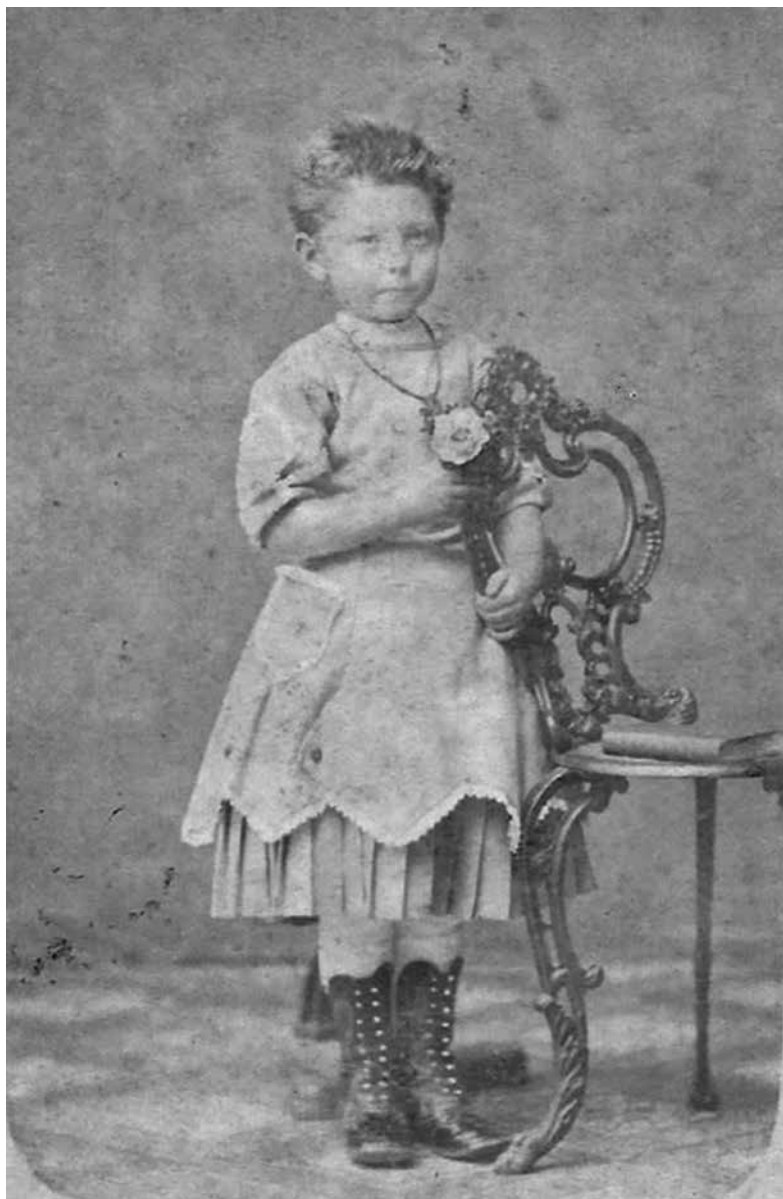
Simke as famke fan fjouwer jier. Alder foto is net oerlevere.