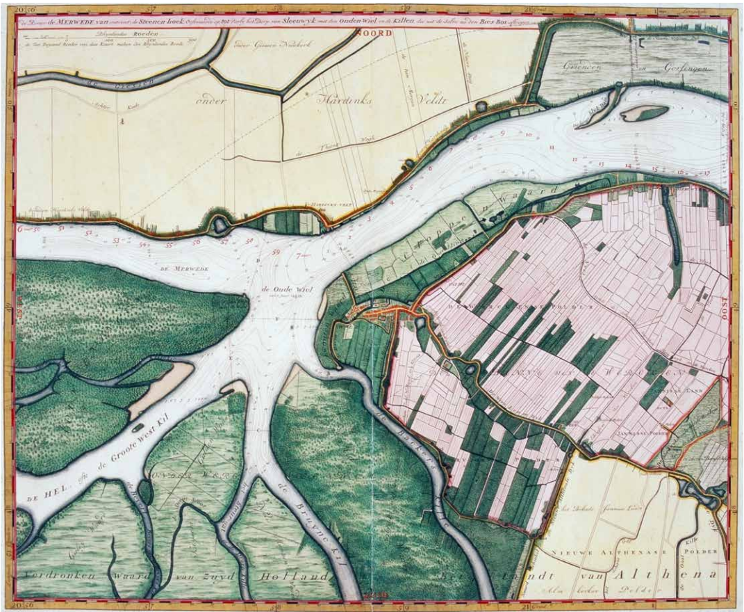
Kop van de Oude Wiel (Cruquius, gravure) Blad 1 van de kaart in twee bladen van de rivier de Merwede van Gorinchem tot Dordrecht, het land van Altena, een gedeelte van de Biesbosch en het zuidelijke deel van de Alblasserwaard, 1731. 8 In het midden is Werkendam gelegen, vlak bij diverse grote uit te voeren waterstaatswerken en op de eb- en vloedbeweging te bereiken griend en rietgorzen.