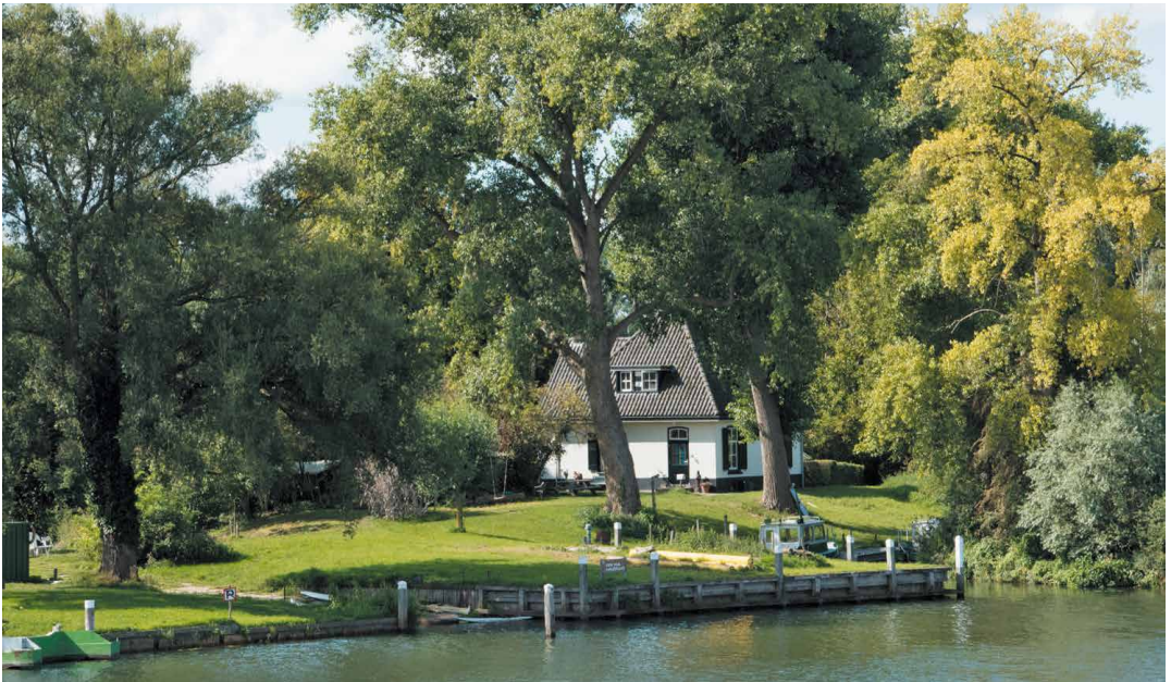
Hulze polder De Dood, midden in de Biesbosch.