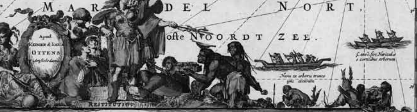
Nieuw Amsterdams veldje Nieuw jorck ande heren van de Nederlanden op den 24 Aug 1673 overleef van de Engelen weder afgeleef