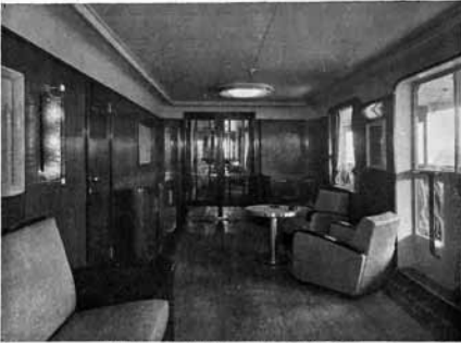
EERSTE KLAS VESTIBULE OP PROMENADEDEK (Ontwerp Pander)