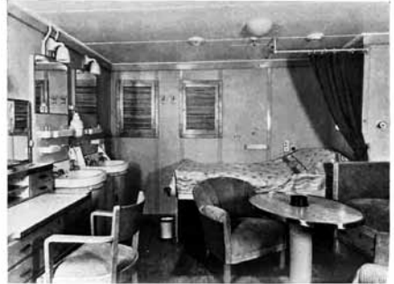
EERSTE KLAS HUT