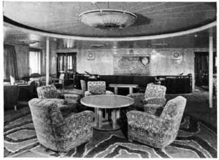
MUZIEKSALON (Ontwerp Roca)