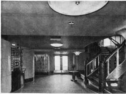
EERSTE KLAS ENTREE EN TRAPPENHUIS (Ontwerp Pander)