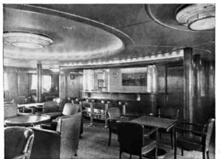
ROOKZAAL, BAR (Ontwerp Allen)