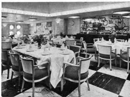
EERSTE KLAS EETSALON (Ontwerp Pander)