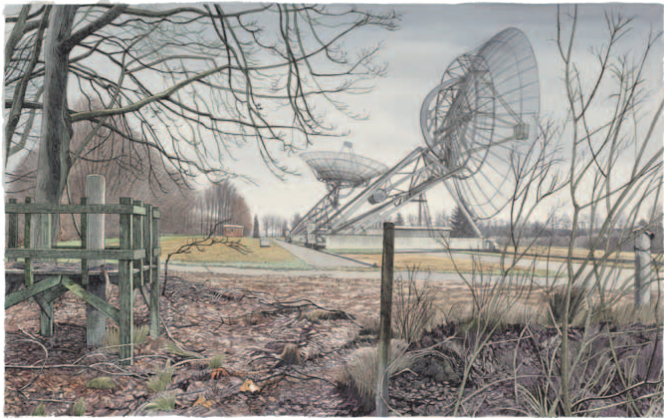
Siemen Dijkstra, Sterrenwacht Westerbork Halkenbroek, 27 x 43 cm, 2024