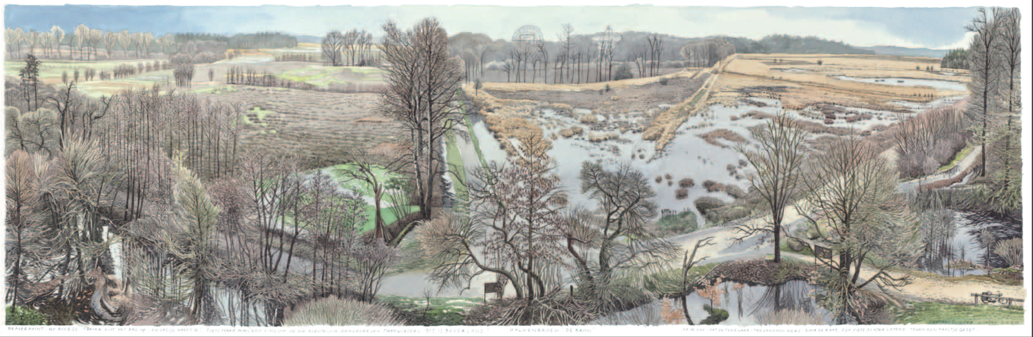
BEAVER POINT - NO ACCESS - "BAKKA EIST MET DAL OP - EN GELEIJ KREFTIG" - FIETS NAAR HOO, EEN EINDOM OP DE ELEKTRISCH AANGESLUIKVEN THREWIEKERS - DIT IS BEVERLAND! - HALKENBROEK "DE BRON" - OP DE DAL - DAT DE TEGENWAAR - TREGENDHEN WERD - DOOR DE RAAR, ZIJN FIETS ACHTER LATEND - TEGEN REN PAALTJE GEZET.