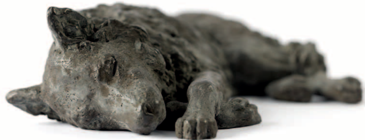
☞ Gineke Zikken, wolf, schets, potlood, 8 x 7 cm, 2023

Dit project heeft een spirituele kant. Alles wat zich rondom dit project afspeelt – dat we samenwerken om hetzelfde doel te bereiken en naar elkaar toe groeien, dat we ervaringen delen en erover vertellen – dat was allemaal niet gebeurd als ik dit in mijn eentje had gedaan. Een aantal dingen die ik bij de andere deelnemers zie, herken ik. Je moet in dit project 'met de billen bloot'. Je ziet van elkaar hoe het proces verloopt en accepteert dat het op een dag wel eens minder goed lukt, maar ook dat is waardevol. Het maakt mij eens te meer duidelijk waarom ik dit doe.