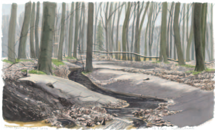
Siemen Dijkstra, Halkenbroek De Bron, potlood en inkt, 23 x 35 cm, 2024