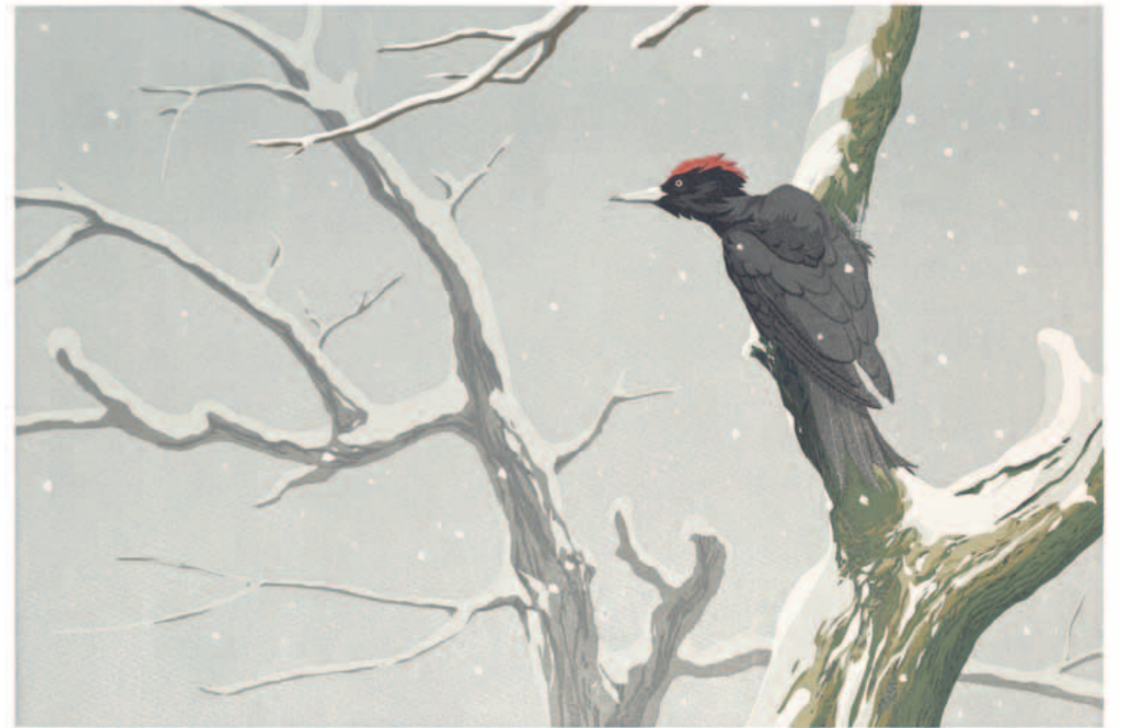
Erik van Ommen, Het geluid van het woud - Zwarte specht, reductiehoutsnede, 28 x 42 cm, 2024