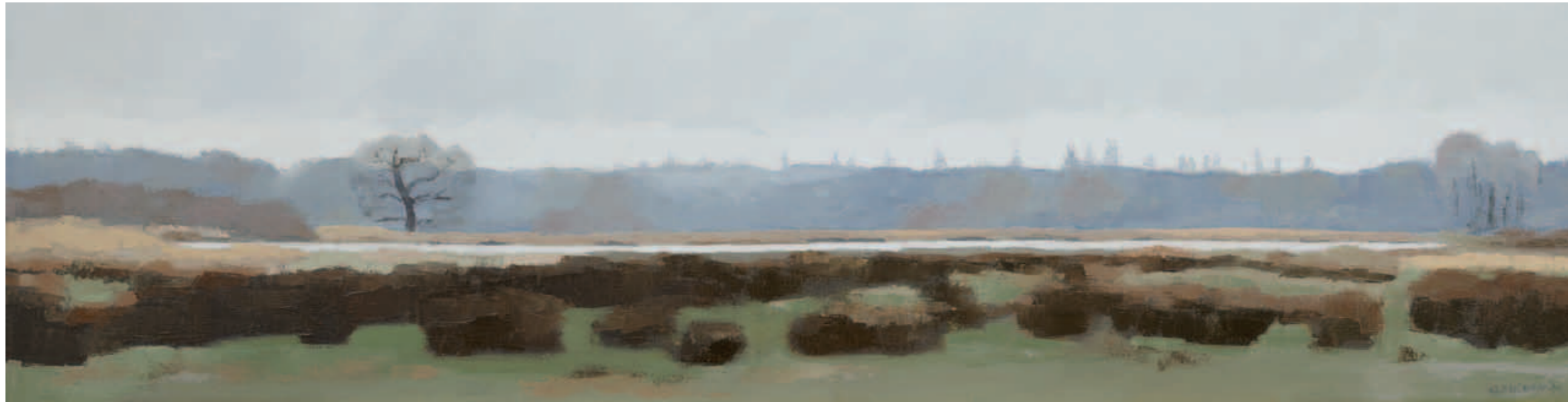
↑ Gineke Zikken, Brongebied Drentsche Aa 1, olieverf, 30 x 120 cm, 2024