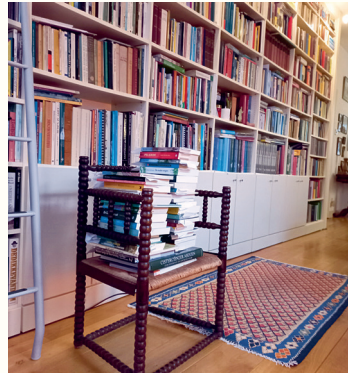
‘Work in progress’, selectie van pelgrimsverslagen voor dit boek opgestapeld.

Ik beperk me in mijn verkenningen naar de magie van de camino grotendeels tot als boek uitgegeven Nederlands-talige caminoverslagen van pelgrims sedert de jaren negentig van de vorige eeuw, de periode dus van de enorme opleving van de ‘moderne camino’. Het Heilig Jacobus Jaar 1993 wordt wel als een soort kantelpunt in de toestroom van pelgrims naar Santiago beschouwd.