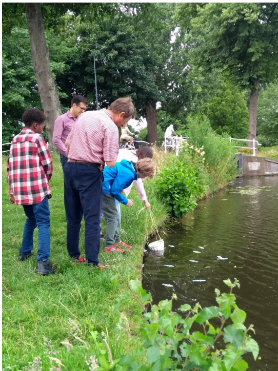
Samen 'vissen' met de kinderkerk, Leiden juli '22

(Te koop bij: LTC Leiden en andere hobby-winkels)