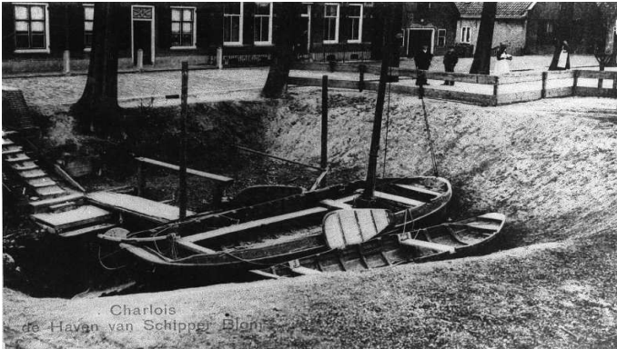
--Haven van schipper Blom

‘En die ambachtsheer, heeft die nog zijn zin gekregen?’