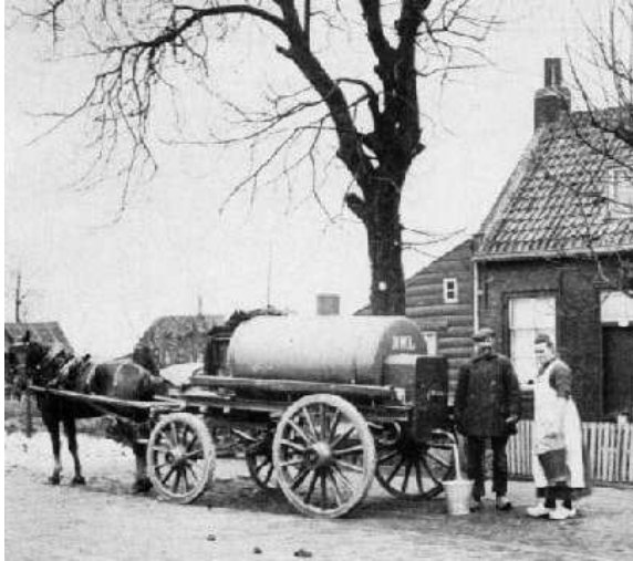
Distributie van drinkwater

‘Enkele jaren later was er weer kwalijk voorval. Rotterdam hoogde een deel van de Kerkegriënt op met bagger uit de haven van Delfshaven. Het leek wel klinkklare stront. Door regenval spoelde een deel van die