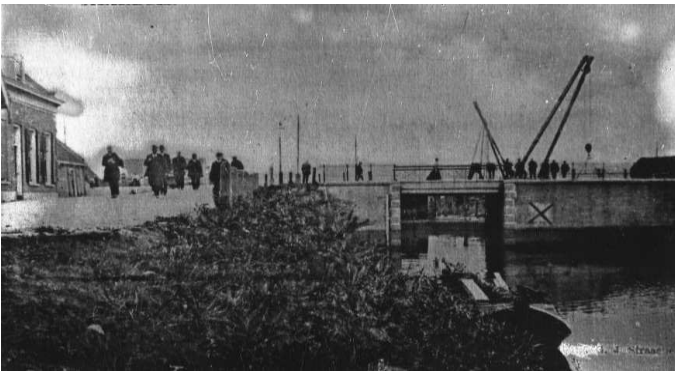
Spoorbrug over de Charloise haven