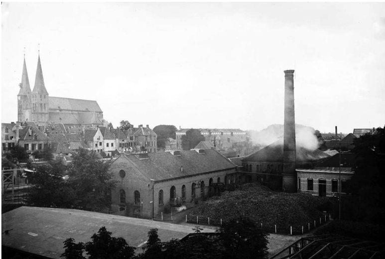
Figuur 1 Deventer: gezicht op de Gasfabriek Raambleek, Bergkerk en het Bergkwartier op de achtergrond voor 1910.

Ten slotte wordt in een apart hoofdstuk Besluit onder andere ingegaan op wat er verder gebeurde met de familie in het laatste deel van de oorlog, de Bersiap periode en de hieropvolgende jaren.