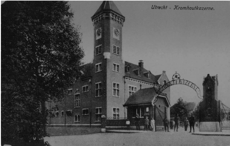
Figuur 6 Gezicht op de voorgevel van het wachtgebouw links van de hoofdingang van de Kromhoutkazerne (Prins Hendriklaan 75) te Utrecht. (oude ansichtkaart, 1913-1918,).