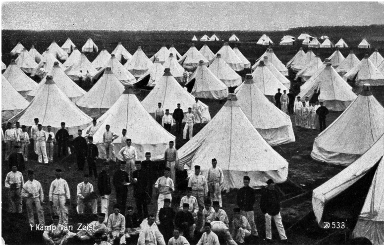
Figuur 4 Gezicht op enkele rijen tenten in het Kamp van Zeist te Zeist; met op de voorgrond een grote groep militairen. (oude ansichtkaart, 1910-1915,).