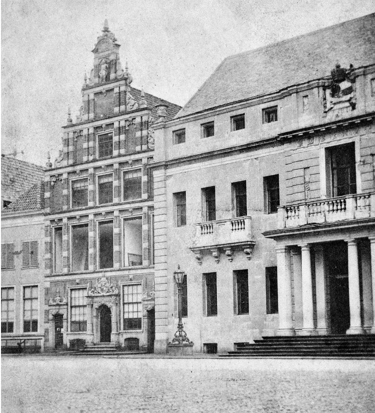
Figuur 2 De zeventiende-eeuwse voorgevel van het Landshuis, met rechts de entree van het stadhuis aan het Grote Kerkhof ca. 1880.