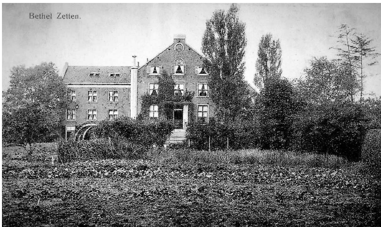
Figuur 7 Het huis Bethel van de Heldringstichting (ansichtkaart uit ongeveer 1904, fotograaf onbekend).