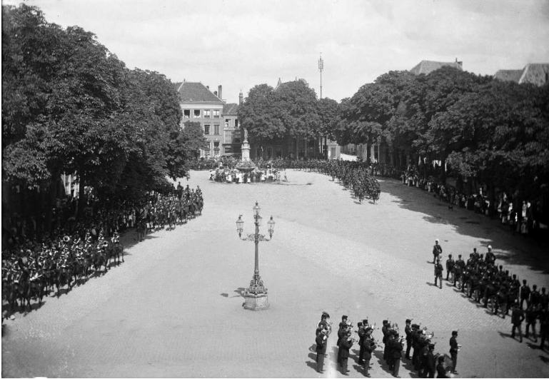
Figuur 3 Overzichtsfoto van de jaarlijkse parade der Huzaren t.g.v. de 24-jarige koningin Wilhelmina op De Brink 31-8-1904.