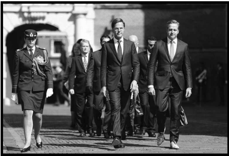
Mark Rutte (links) en Hugo de Jonge (rechts) lopen gebroederlijk naast elkaar in 2018.

Dit ministerie is verantwoordelijk voor coördinatie van het regeringsbeleid en overheidscommunicatie. 6 Dit is de reden, waarom (demissionair) premier Rutte altijd de persconferenties opent met een samenvatting van de maatregelen. Hij wordt altijd gevolgd door een minister om de daadwerkelijke inhoud en details over de maatregelen toe te lichten.