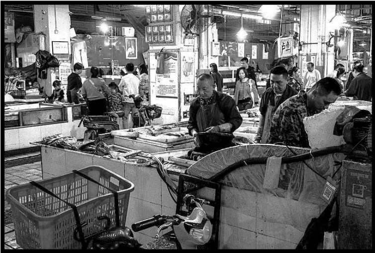
Voedselmarkt in Wuhan, november 2019. © Skoleopgave 1. 18

slachtoffers maakte (oktober of november 2019). Als dit het geval is, dan zou de markt van Wuhan gevrijwaard zijn van Ground Zero (ontstaansplaats) van het coronavirus. 17 Maar of de herkomst van het virus ooit achterhaald gaat worden? Dat blijft voorlopig koffiedik kijken.