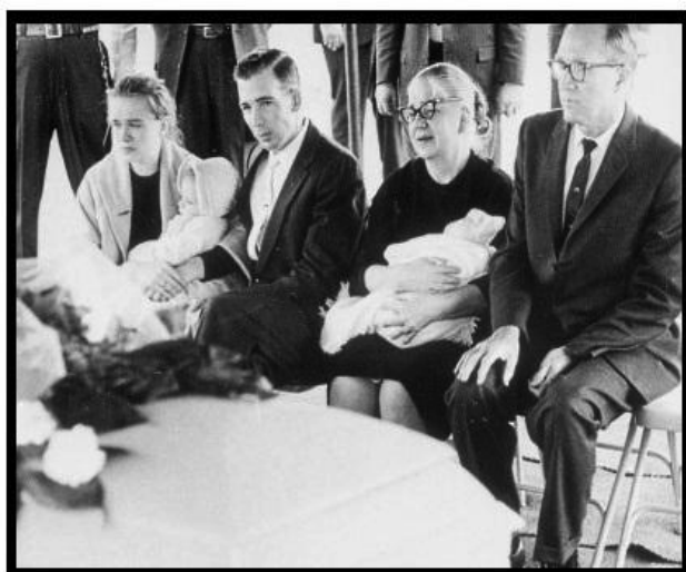
Oswald family at funeral