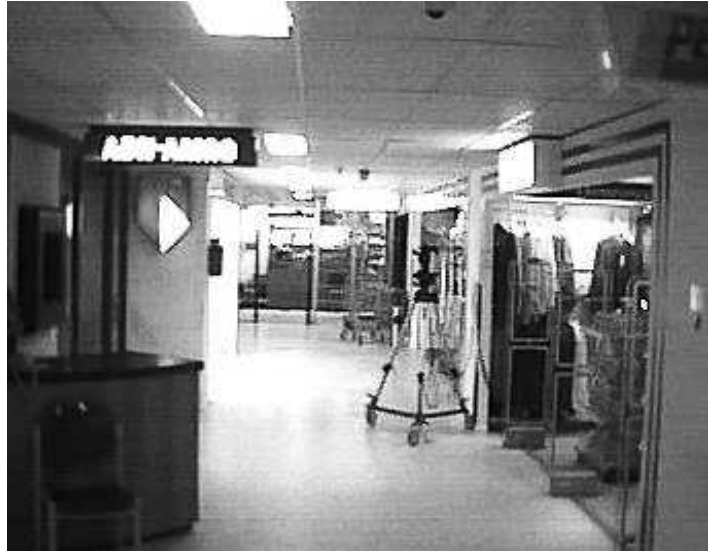
Advies & Trainingscentrum

in dienst had ik al geleerd hoe je automobilisten moest aanspreken en wat de gevaren kunnen zijn. Ik legde mijn handen op het portier, mijn rechterhand ging voorzichtig op het knopje van de deursluiting, wat hij gelukkig niet door had. Hij deed nogal boos (gespeeld), zwaar onder protest wilde hij zijn portier open gooien zette zijn schouders er tegenaan maar helaas de deur bleef dicht,