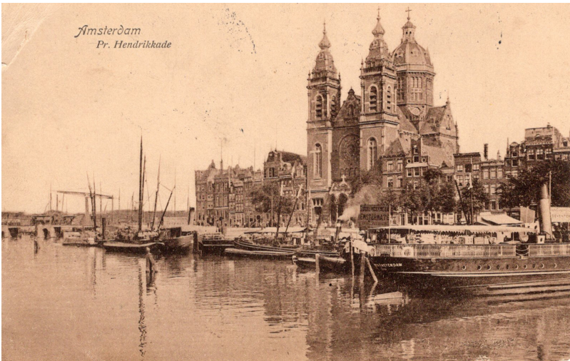
Ansichtkaart met Prins Hendrikkade en Sint Nicolaaskerk, omstreeks 1900