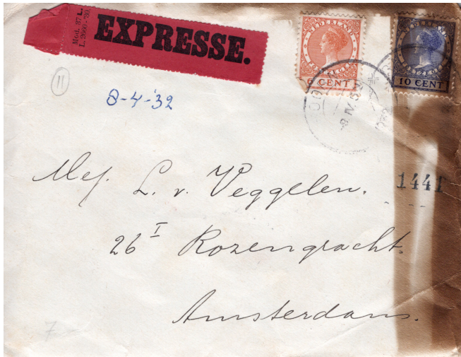
Envelop van brief van mijn vader aan mijn moeder, van 8 april 1932, met door de brand geblakerde randen.

ze moeilijk verscheuren of verbranden, en er zijn er een massa, Oud-je!' Gelukkig zijn de brieven zeventien jaar later niet verbrand bij de brand in 1940 van hun latere woonhuis in Blokker.