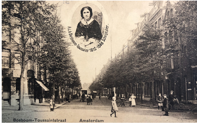
Ansichtkaart van de Bosboom Toussaintstraat, begin twintigste eeuw.