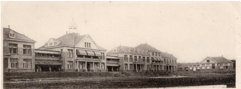
R. K. Sanatorium „Dekkerswald“, Groesbeek. Voorzijde.

Later, toen ik in het onderwijs werkzaam was en jaarlijks naar de tbc-keuring moest, kreeg ik van de mantouxtest een heftige reactie op mijn arm. Dat was een gevolg van wat me in mijn jeugd was overkomen.'