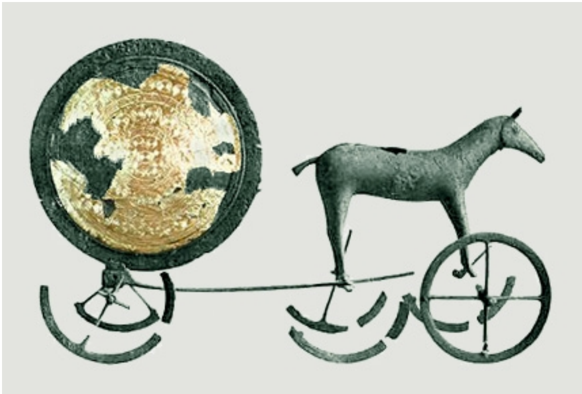
De Zonnewagen van Trundheim/ Denemarken uit ca. 1500 v.C.:

een straf van de Goden: alleen deze Goden mochten mensen en dieren maken en afbeelden. Tijdens de daarop volgende duizenden jaren van de megalietenbeschaving in Europa zien we dan ook geen afbeeldingen van levende wezens. Dat was een taboe. En dit verbod is later door vluchtelingen meegebracht, b.v. naar Kanaän, het latere Palestina. Daar belandde via Egypte ook het monotheïsme van farao Echnaton, en na een machtsstrijd tussen de Maangod van Juda en de Zonnegod van Echnatons opvolgers werd dit verbod opgenomen in het jodendom, en vele eeuwen later ook in de islam. Zo was het mogelijk Zon en Maan te verenigen”