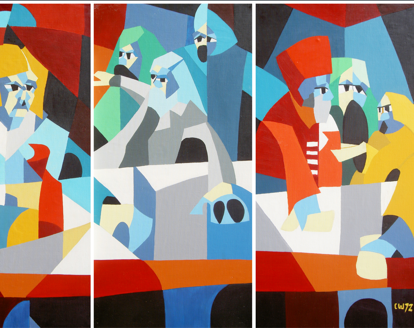
1972 / Het Laatste Avondmaal / Olieverf / 200 x 78 cm.