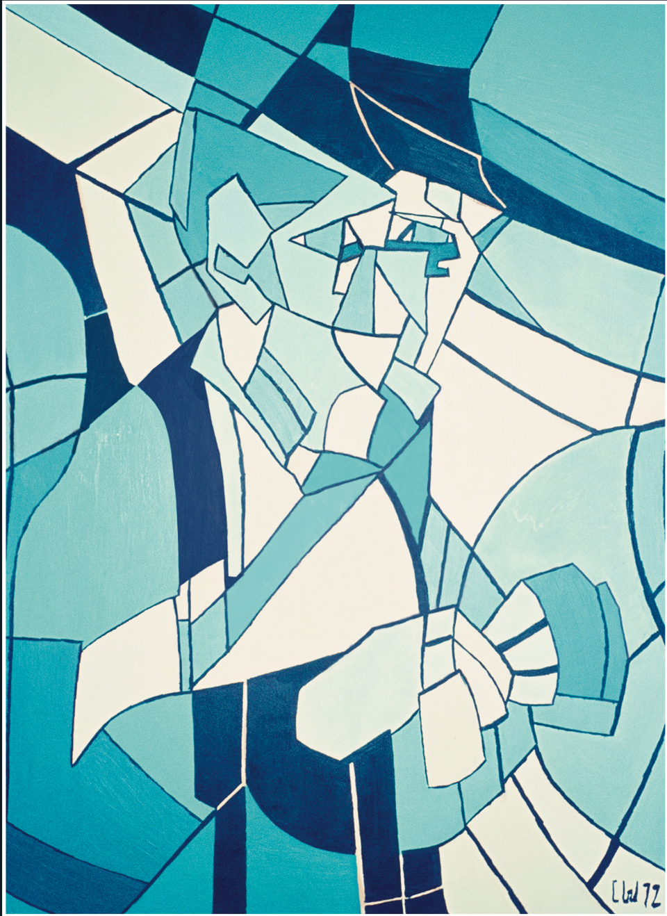
1972 / Model / Olieverf / 60 x 70 cm.