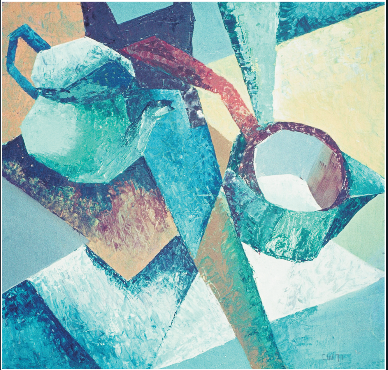
1971 / Stilleven met zaag / Olieverf / 50 x 50 cm.