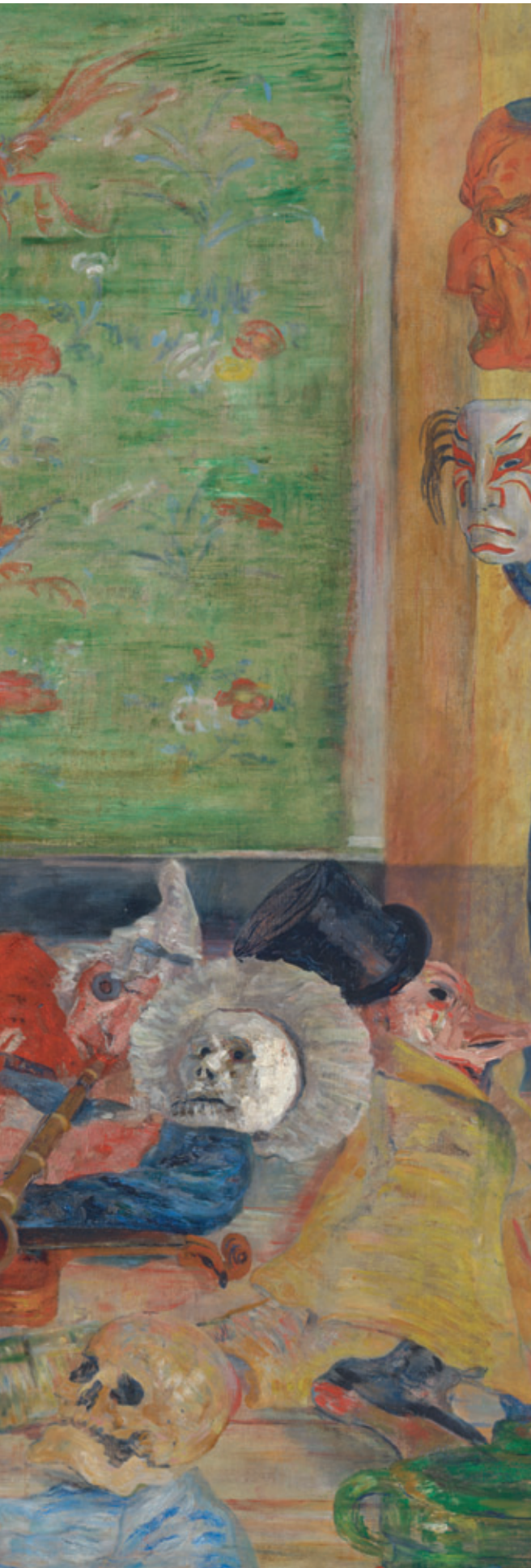
AFB. 19 James Ensor, De verbazing van het masker Wouse , 1889, olieverf op doek, 109 × 131 cm, Koninklijk Museum voor Schone Kunsten Antwerpen – Collectie Vlaamse Gemeenschap