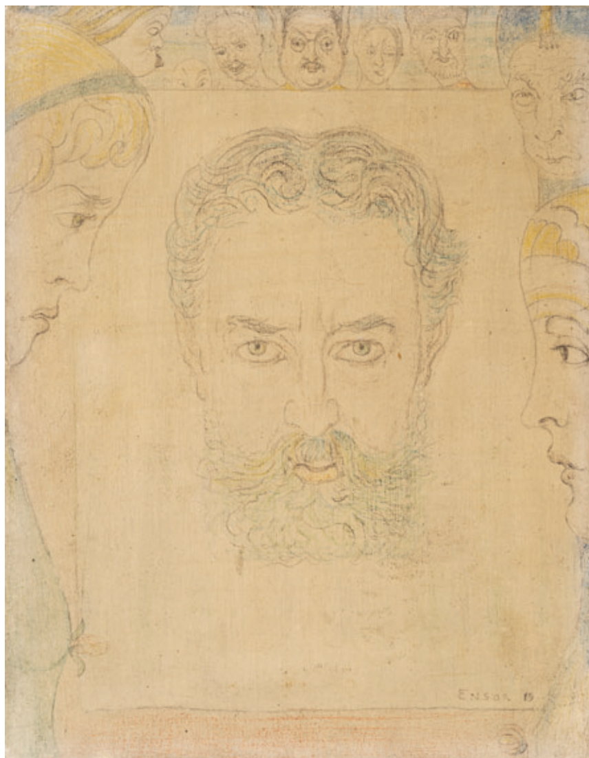
AFB. 11 James Ensor, De vertroostende Maagd , 1892, olieverf, goudverf, kleurpot- lood en potlood op geprepareerd paneel, 48 × 38 cm, Museum voor Schone Kunsten Gent – Collectie Vlaamse Gemeenschap