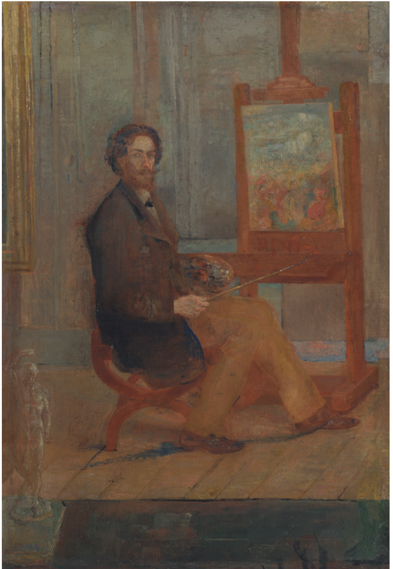
AFB. 7 James Ensor, Zelfportret aan de schildersezel , (1890?), olieverf op doek, 59,5 × 41 cm, Koninklijk Museum voor Schone Kunsten Antwerpen – Collectie Vlaamse Gemeenschap