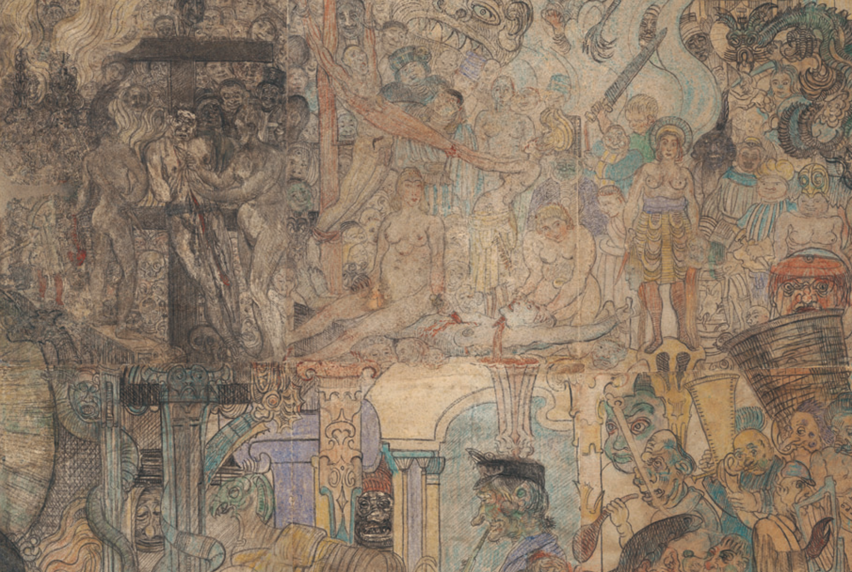
DETAIL VAN AFB. 173 James Ensor, De verzoeking van de heilige Antonius , 1887

Adam en Eva uit het paradijs verjaagd maar vooral de hallucinante tekening De verzoeking van de heilige Antonius , beide uit 1887, zijn als het ware demonstraties van hoe Ensor wilde waanbeelden creëert door, zoals hij het enkele jaren later zelf zal toegeven, de meest tegengestelde manieren (lees: stijlen) nauwgezet uit te proberen (“ j’ai étudié alors attentivement les manières les plus opposées ”). 49