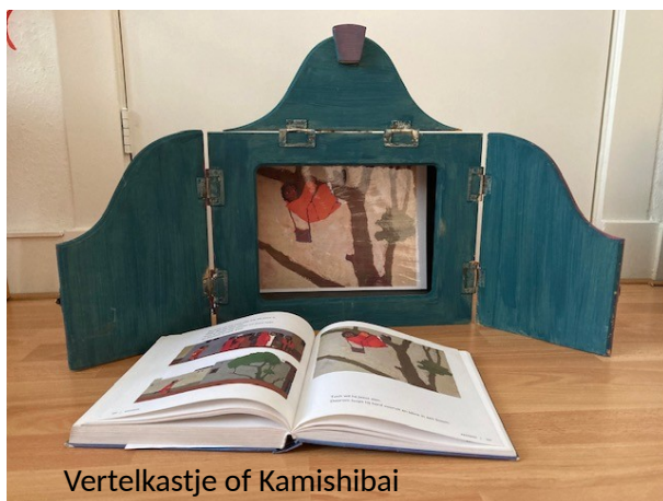
Vertelkastje of Kamishibai

Jongere kinderen daarentegen, trekken zich graag op aan de oudere kinderen, en zijn in staat om zelfstandig iets op te pikken uit het programma, ook al begrijpen ze dat maar voor een deel.