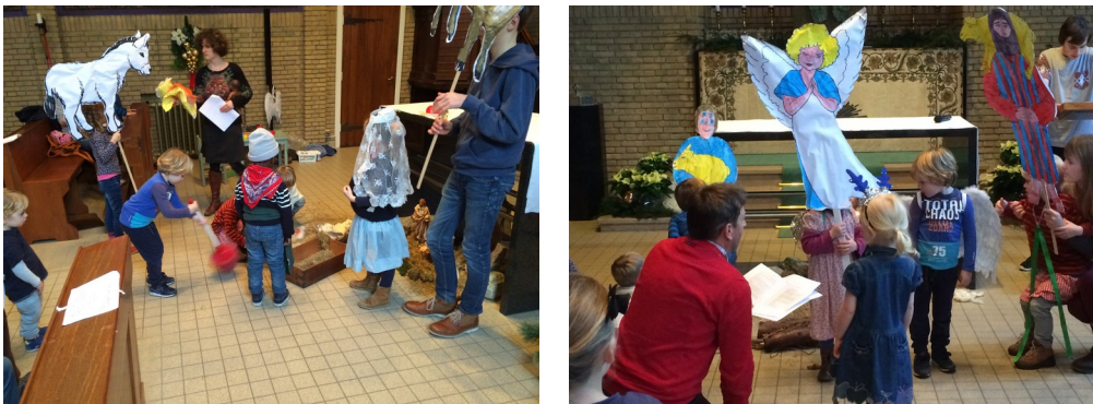
Kerstviering met de kinderkerk, Leiden 2015

In de kinderkerk heeft Schat Zoeken een vrij lange looptijd, van ongeveer anderhalf tot drie jaar. In totaal zijn er 14 thema's. De methode werkt met cycli, waarin elk thema nog een keer terugkomt met een andere uitwerking. Nadat alle thema's behandeld zijn, keert de methode dus terug bij het eerste thema, namelijk 'God' en verzamel je een nieuwe schat bij dit thema. Zo leer je telkens een nieuwe invalshoek kennen, en verdiept je inzicht in de thema's zich gaandeweg. Je kunt je leven lang met deze thema's bezig blijven. Het uitgangspunt is niet het vinden van antwoorden, maar het stellen van vragen, en het aannemen van een open, zoekende houding. Alleen als je zoekt, zul je vinden.