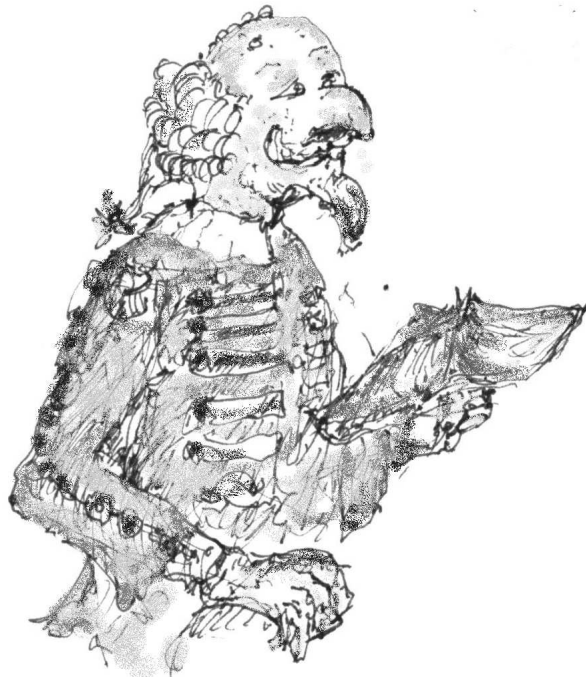
afbeelding 3 Baron von Münchhausen vertelt...

Met wat hulp van de plaatselijke kleermaker lukte het hem om zijn paard weer aan elkaar te naaien en zo te repareren.