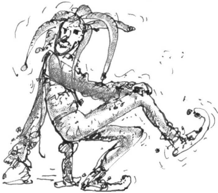
afbeelding 1 Tijn Uilenspiegel