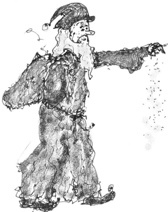
afbeelding 4 Klaas Vaak strooit zand

Vlak voor het slapen gaan, komt Klaas Vaak je slaapkamer binnen. Hij strooit dan slaapzand in je ogen en die vallen als vanzelf dicht. Je slaapt en gaat lekker dromen. In de morgen, wanneer je je ogen uitwrijft, komt er soms nog wat van dat zand uit.