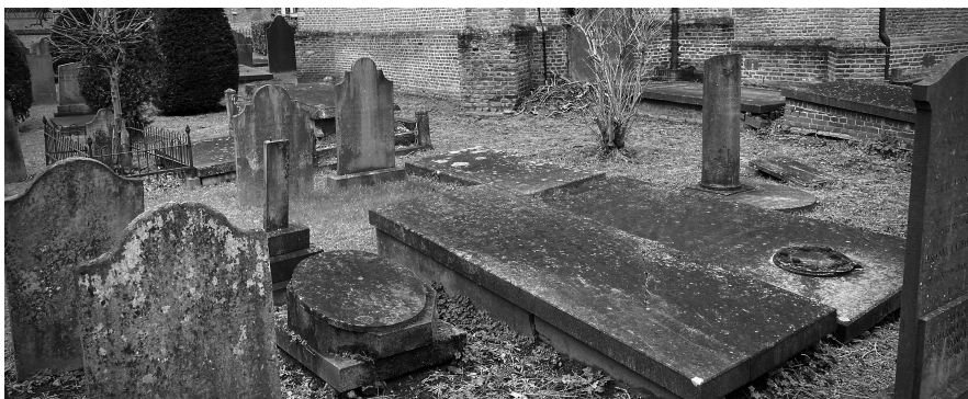
afbeelding 2 Kerkhof met grafzerken

Naast het kerkhof stond een kerkje met een hoge toren. Toen zag hij dat zijn paard met de teugels aan de torenspits bengelde. Snel pakte hij zijn geweer en schoot het kruis van de toren af. Zijn paard viel naar beneden en was gelukkig niet gewond. Daarna kon de baron op zijn paard zijn tocht weer hervatten.