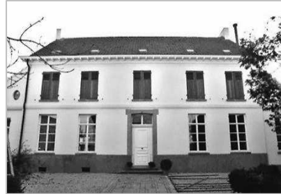
De pastorie voor en na de renovatie.

De Godveerdegemse kapel van Onze Lieve Vrouw van Bijstand uit de 18 de eeuw was tot voor kort eveneens als monument beschermd. Deze kapel werd opgetrokken in barokke stijl en situeerde zich in de Leliestraat. Wegens slecht onderhoud begon ze al in de jaren '70 van de vorige eeuw te vervallen, tot na hevige stormen alleen nog de afgebrokkelde muren overeind bleven (mijn broer en ik hebben deze kapel nog in originele staat gezien en bezocht). De stad Zottegem heeft trouwens bij de Vlaamse overheid al meermaals een officiële vraag tot declassering ingediend, zodat men de restanten van het religieuze gebouw zou kunnen afbreken. In 2011 was het de vierde keer dat de stad dit verzoek indiende. Eerdere verzoeken werden al ingediend in 1980, 1990 en 2001. In plaats van gehoor te krijgen, kwam het tot een rechtszaak waarbij de stad door de rechtbank van eerste aanleg in Oudenaarde op 19 december 2013 veroordeeld werd tot instandhoudingswerken en het opmaken van een dossier voor volledige restauratie. Hierop werden stuttingswerken uitgevoerd, maar een echte heropbouw en restauratie zag de stad Zottegem niet zitten wegens de vergevorderde staat van verval en de te hoge kostprijs. Onroerend Erfgoed