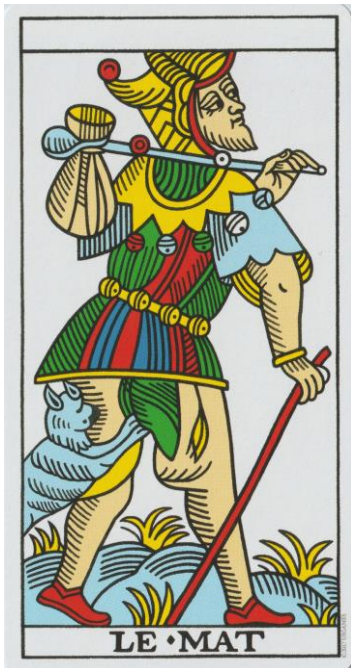
De Dwaas CBD Tarot de Marseille

De Dwaas handelt naar zijn of haar intuïtie (of instinct) die wordt gesymboliseerd door de hond of kat. De hond of kat scheurt de kleren van het lijf van de Dwaas. Kleren symboliseren oude gewoontepatronen, oude persoonlijkheidskenmerken en oude identiteit. In de knapzak van de Dwaas is de collectieve ziel verborgen. Dit zijn de nog onbewuste kennis en kwaliteiten van de Dwaas. Bij de Tarot van Waite stapt de Dwaas een afgrond in. De afgrond symboliseert het onbekende. De Dwaas is onwetend.