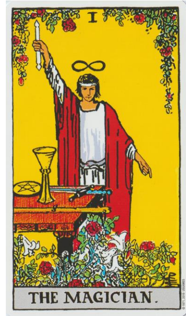
De Magiër The Rider Tarot Deck

Het element aarde staat symbool voor de materie. In het spel van Marseille wordt dit element weergegeven door munten en dobbelstenen. Bij het spel van Waite wordt dit element gesymboliseerd door het pentagram.