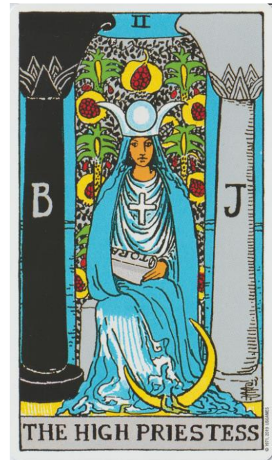
De Hogepriesteres The Rider Tarot Deck

In de Tarot van Waite wordt de scheppende kracht van de Hogepriesteres als Grote Godin verbeeld door de stroom water die uit haar schoot ontspringt en door de granaatappelen achter haar die symbool staan voor vruchtbaarheid.