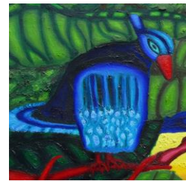
Detail schilderij 'De Dwaas' 4

In zijn ontmoetingen en relaties met andere mensen ervaart de Dwaas zijn verbondenheid met mensen in dit leven, die soms teruggaat tot meerdere vorige levens. Sommige van deze verbindingen verbreekt de wetende vogel met zijn rode snavel wanneer de tijd gekomen is.