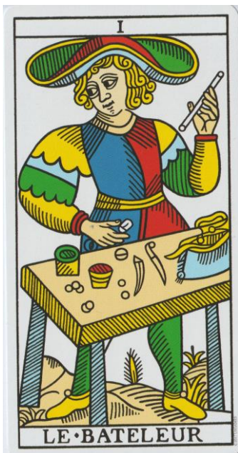
De Magiër CBD Tarot de Marseille

De wilskracht, onder andere in de vorm van het initiatief, werkt vanuit de Wet van Oorzaak en Gevolg, weergegeven door het lemniscaat, in de stof (materie). De Magiërs zijn de tovenaars en de medicijnmannen. De Magiër bemiddelt tussen twee werelden, de innerlijke spirituele wereld en de uiterlijke materiële wereld. De valkuil van de Magiër is het handelen vanuit het ego. Macht verkrijgen, machtsmisbruik en eigenbelang gaan dan centraal staan.