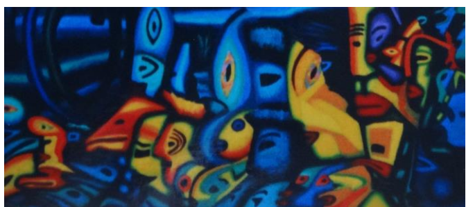
Detail schilderij 'De Dwaas' 2

Wolven verwijzen naar de geketende oerkrachten in het onbewuste. Het zijn de bewakers van de poorten van de dood en van de onderwereld. Wolven zijn de begeleiders van de zielen van de doden en van de levende zielen door middel van intuïtie.