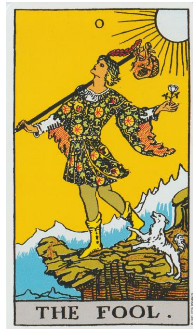
De Dwaas The Rider Tarot Deck

De Dwaas is de mens op weg, als een kind, vanuit een onbewuste impuls. Er is geen angst, geen zelfreflectie, geen idee van de zin of transformatie in het leven. Er wordt gehandeld vanuit een onbewuste dorst of onbewuste wil (wilskracht is levenskracht).