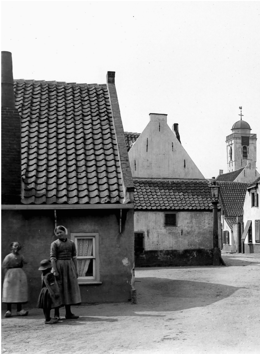
Katwijk rond 1900.