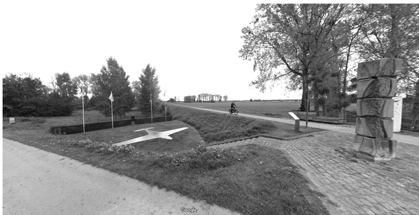
Monument langs de invasiestraat in Vucht op de plaats waar het vliegtuig neergestort is.

De Fuhrer had daarop besloten zijn blitzkrieg uit te stellen naar de lente.