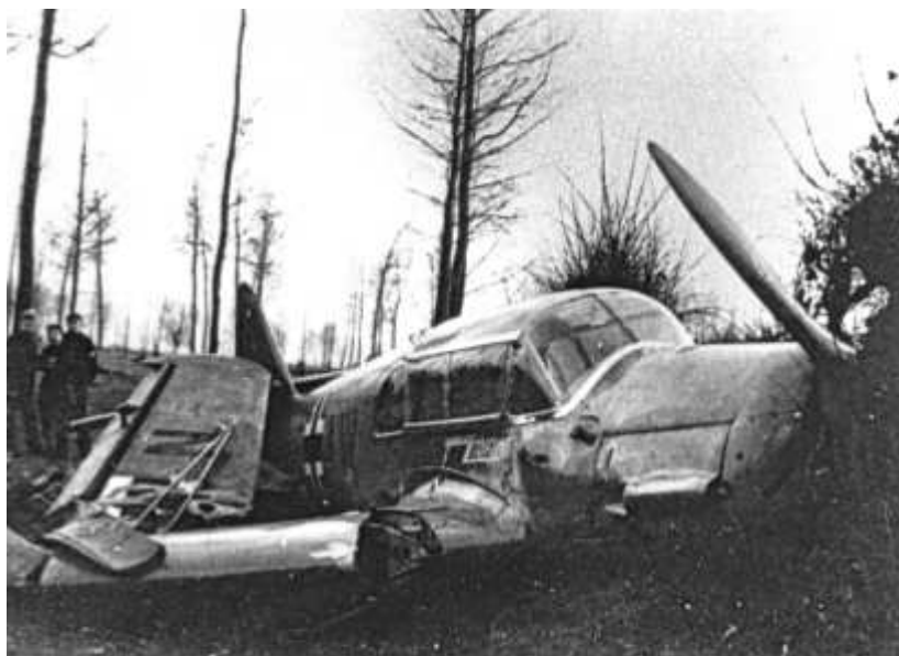
Neergestort vliegtuig te Vurst. (foto replica)

sneeuw naar hem toe. De boer wist niet wat er hem overkwam, stak beide handen omhoog en moest zeggen waar ze precies waren terechtgekomen. Tot hun grote schrik vernamen de Duitsers dat ze in het Belgisch dorpje Vucht, nabij het huidige Maasmechelen, waren geland. De rivier die ze vanuit de lucht hadden gezien, was dus niet de Rijn maar de Maas! Door de mist waren ze bijna tachtig kilometer uit koers geraakt.