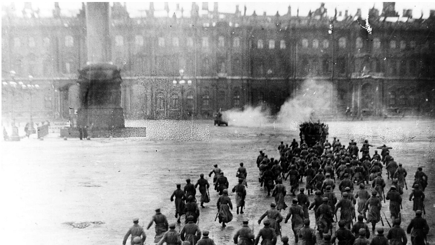
De bestorming van het Winterpaleis door communistische aanhangers van Lenin tijdens de Oktoberrevolutie in 1917, waarbij de eerste communistische staat ter wereld ontstond: de Sovjet-Unie.

communistische partij kreeg in deze nieuwe staat de alleenheerschappij. De familie van de tsaar werd tijdens de burgeroorlog vermoord in de stad Jekaterinenburg. De lokale communistische autoriteiten vreesden dat de tsaar en zijn familie door de Witten bevrijd zouden worden. Om dat te voorkomen werd de tsaar geëxecuteerd in een kelder. Randgebieden als Polen, Finland en de Baltische Staten slaagden erin om tijdens de burgeroorlog hun onafhankelijkheid te bevechten van Rusland. Veel van deze landen bezagen het nieuwe Russische bewind met groot wantrouwen. Lenin begon intussen vanuit Moskou met de opbouw van zijn nieuwe communistische staat volgens de revolutionaire principes van Karl Marx. In de praktijk zou dit moeilijker blijken te zijn dan gedacht.