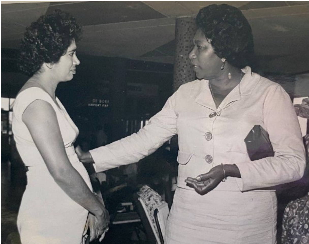
Buurvrouw vrouw B links en mijn moeder in 1965 op vliegveld Zanderij in Suriname tussenlanding op weg naar Nederland 20 december 1965

Op Schiphol had je destijds nog geen tunnels voor de passagiers. Het was koud. Wij kwamen aan op 7 december en Ma kwam op 20 december 1965 aan.