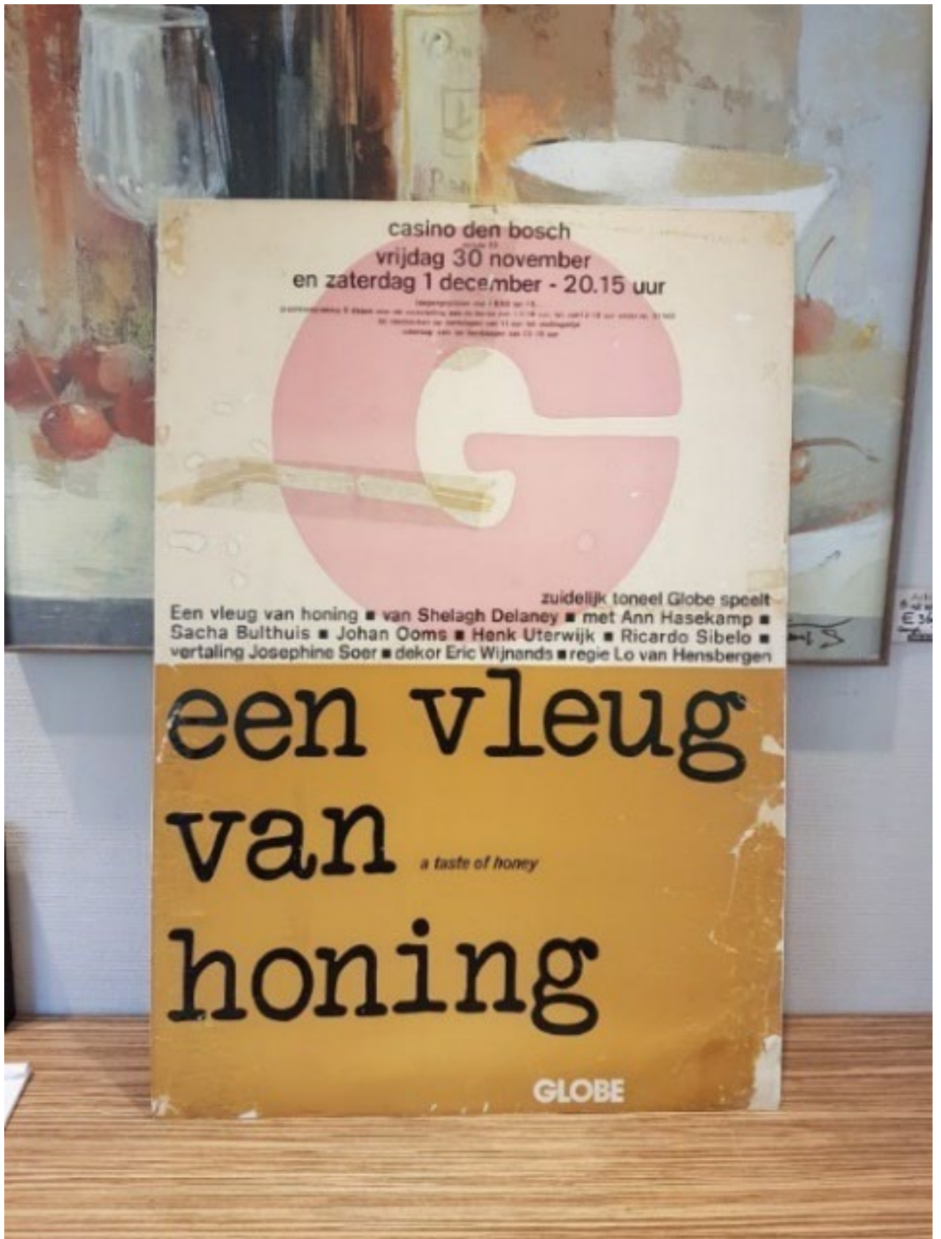
Poster Een Vleug van Honing van het Zuidelijk Toneelgroep Globe