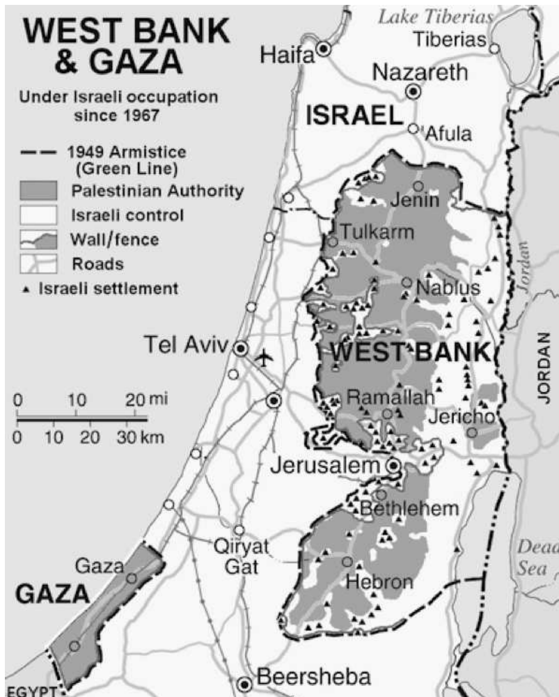
Kaart van Israël-Palestina (1)