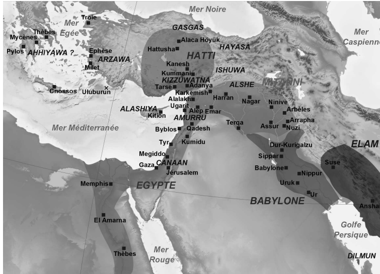
Figuur 1: Kaart van het Midden-Oosten tijdens de Amarna-periode, voordat Amurru onderdeel werd van de Hittitische invloedssfeer, in de eerste helft van de 14de eeuw BCE