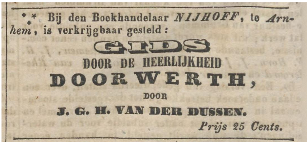
1 Advertentie in de Arnhemse Courant, 10 juli 1840.