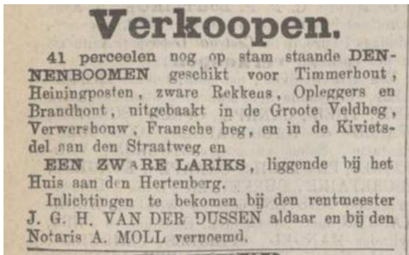
4 Op 16 oktober 1882 plaatst Van der Dussen deze advertentie in De Arnhemse Courant.