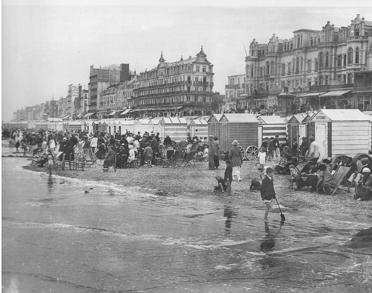
De zeedijk met centraal Hotel de l'Océan

toeschouwers vormden zich om af en toe te applaudisseren.