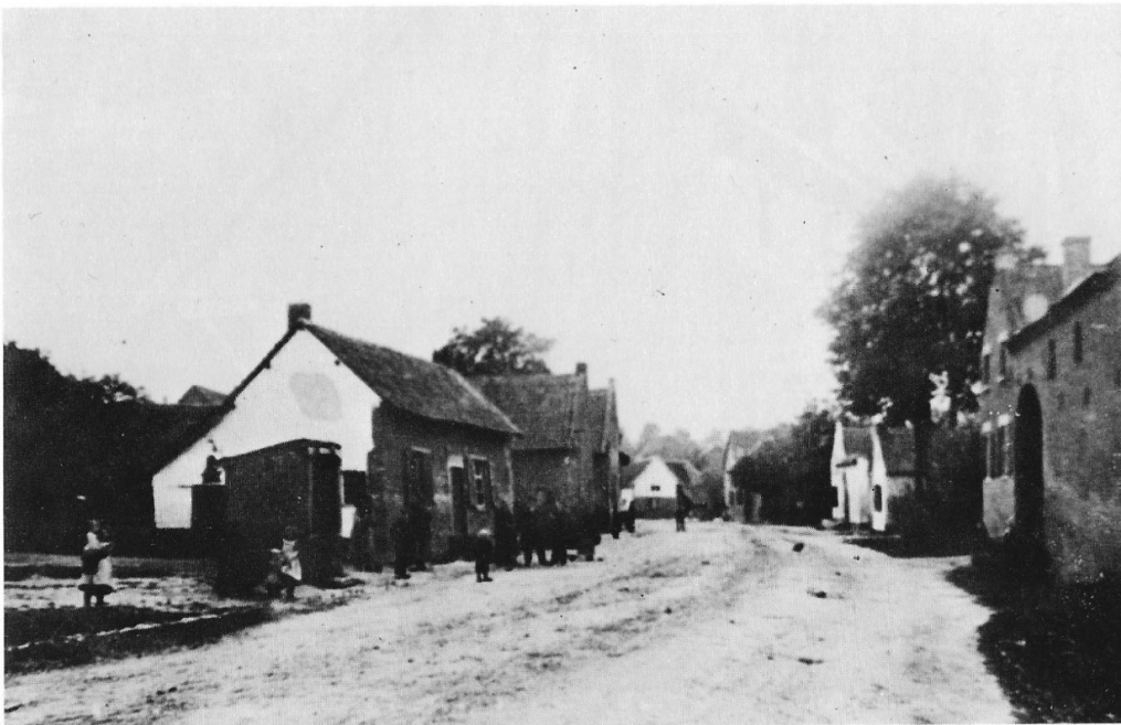
Dorpsstraat omstreeks 1895. De weg is onverhard en naar twee kanten aflopend, om het water in de 'ziepen' af te voeren. Geheel links is de put van Meulenberg, één van de vier putten in het dorp. Euverhaove, een terugblik (1981).