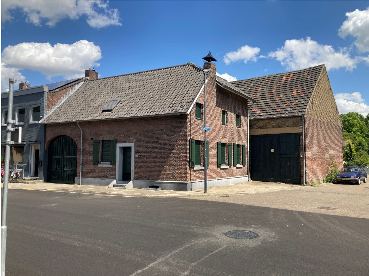
Oud pand in Overhoven bij de Beekstraat.