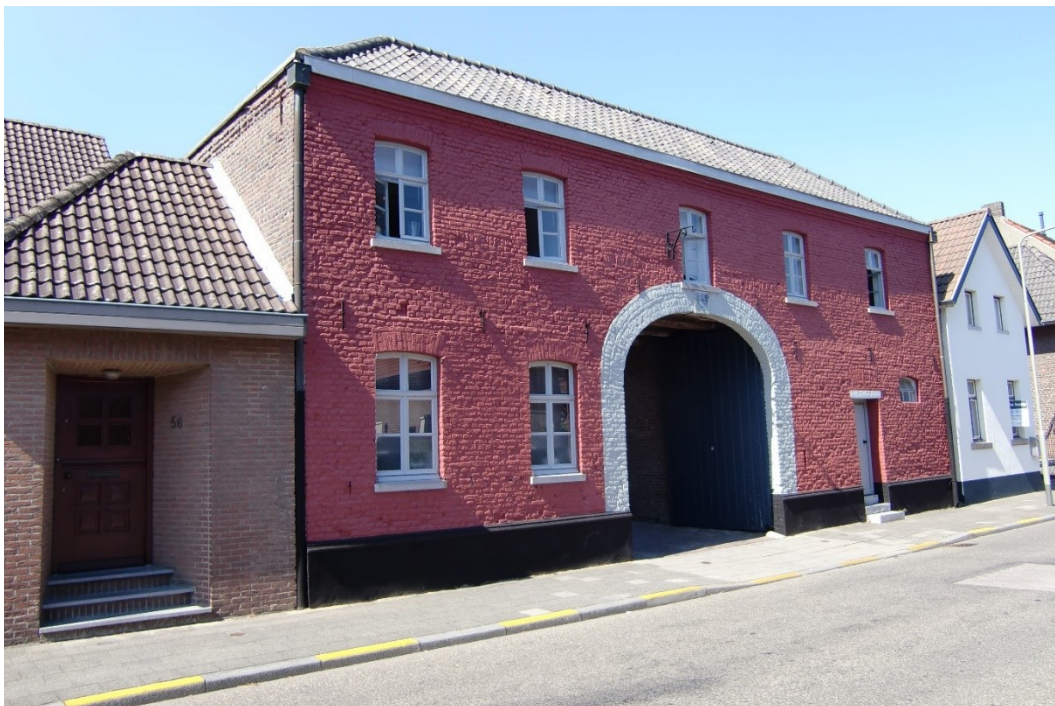
Het oudste pand van Overhoven (ca. 1820).

Met aan de overkant het woonhuis van Marnix de broer van Reinoud. Een pand uit 1820 geverfd in karmozijnrode kleuren afgezet met grijs en een hoge toegangspoort, zoals dat vroeger gebruikelijk was want dan konden de hooiwagens het erf oprijden en aan de achterkant imitatie vakwerk was. Wellicht het oudste pand van Overhoven.