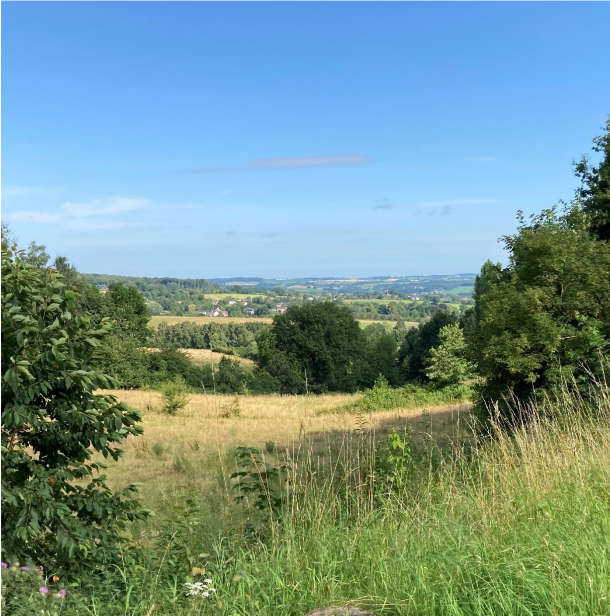
Vergezicht vanaf de pas Wolfhaag-Gemmenich.

Deze keer gingen ze de pas Wolfhaag-Gemmenich over: De Pas van Wolfhaag, ook Schutteberg genoemd, begint bij het kasteel Vaalsbroek. De weg begint met een stevig klimmetje, gaat dan iets vals plat naar beneden tot aan het gevaarlijke kruispunt om dan weer omhoog, langs de Gemmenicherweg, te gaan naar de grenspost uit het verleden. Hier zat op 275 m. NAP de hoogst geplaatste