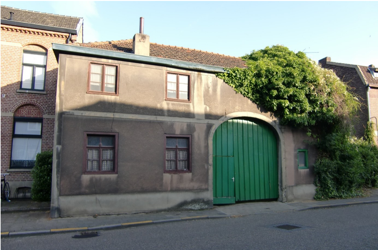
Een van de oudste panden in Overhoven (1899).