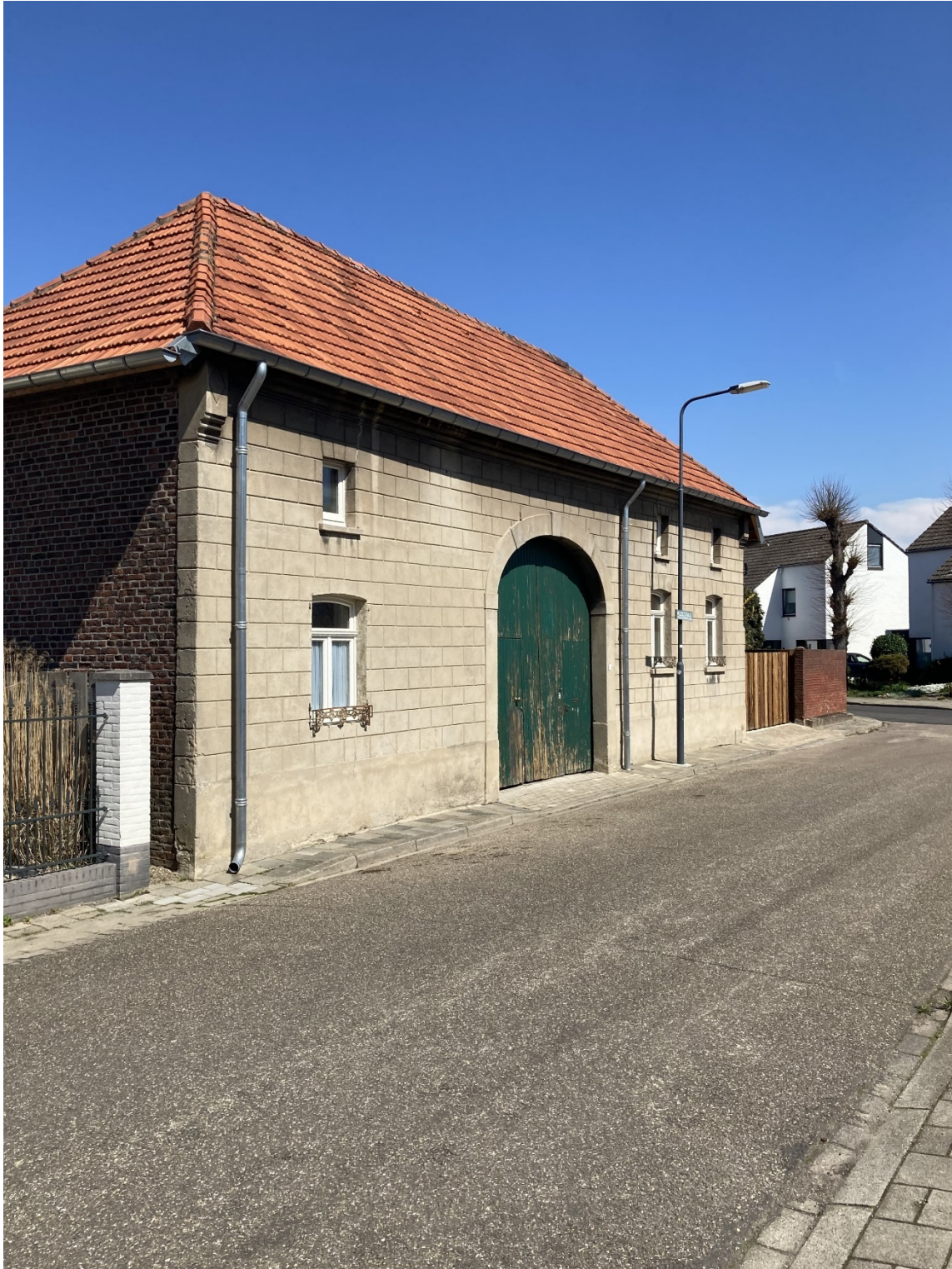
Oude panden in de Vliekstraat te Overhoven.

regenkap. Er waren geen muurankers of jaartalstenen te zien.