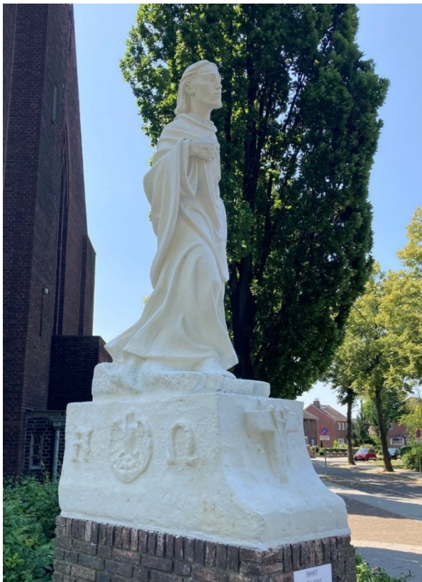
Heilig Hart beeld.

Jezus staat frontaal ten voeten uit op de sokkel. Zijn hoofd is licht naar rechts gebogen en kijkt omhoog. Hij draagt een mantel die tot zijn voeten reikt. Zijn rechterhand wijst naar zijn hart, zijn linkerarm met geopende hand houdt hij langs zijn lichaam.