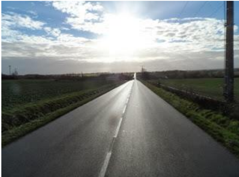
Zilverwitte wegen in Noord-Frankrijk, januari 2014

’) CX, door mij zo genoemd. Kenners weten dat ik een CF bedoel.