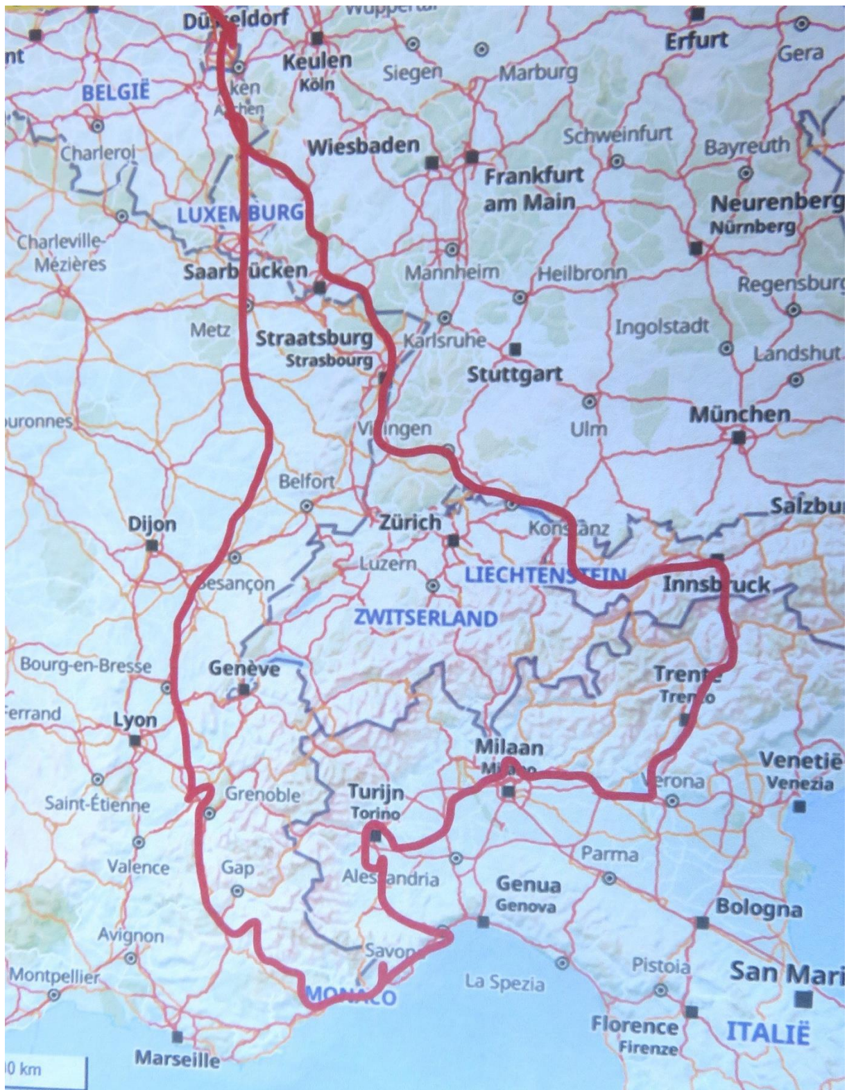
Routekaartje, ca 1200 liter brandstof, 2900 kilometers 3 – 7 februari.