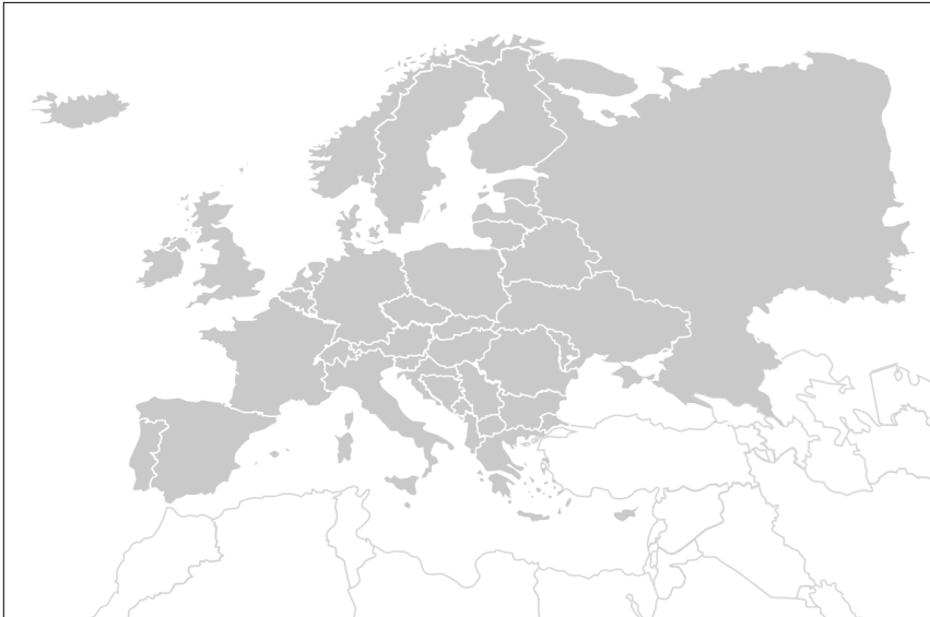
Fig.1 De kaart van Europe in de klassieke definitie van Strahlenberg.

Deze geografische afbakening is gebaseerd op de indeling die in 1730 voor het eerst werd uitgewerkt door de Zweeds-Duitse cartograaf Philipp Johann von Strahlenberg. Een definitie die sinds het begin van de negentiende eeuw gangbaar is en waarschijnlijk door de meeste Europeanen wordt herkend als hun eigen continent.