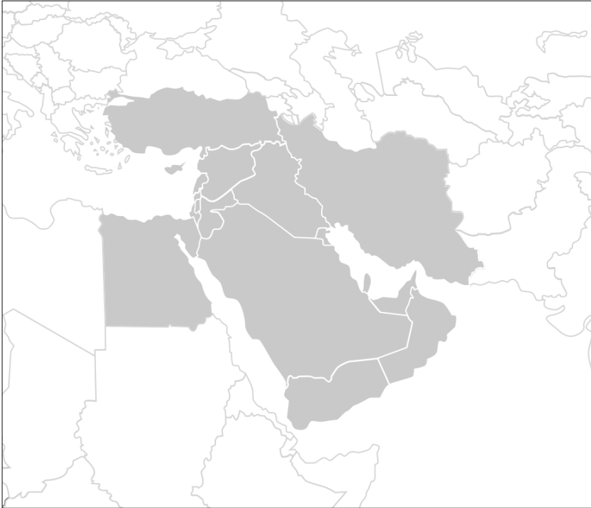
Fig.2 De kaart van het Midden-Oosten in zijn klassieke geopolitieke definitie: zeventien landen, inclusief Egypte, Iran, Turkije en Cyprus.

Egypte vormt daarbij een bijzonder geval. Hoewel het geografisch tot Afrika behoort, wordt het ook tot het Midden-Oosten gerekend, hetgeen niet geldt voor andere Noord-Afrikaanse landen zoals Libië of Algerije.