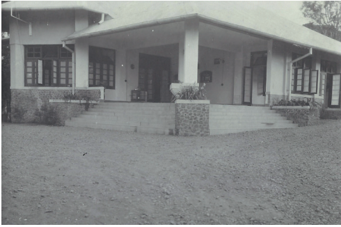
De voorgalerij met links de erkerkamer en rechts de smallere galerij.