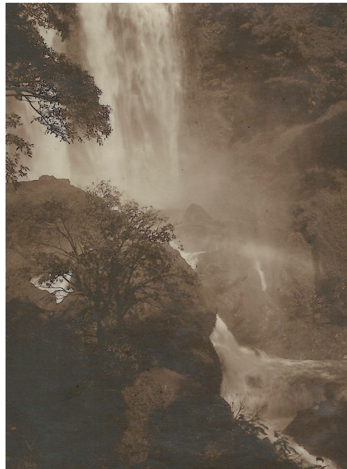
De waterval van Tjoeroeg omstreeks 1930.