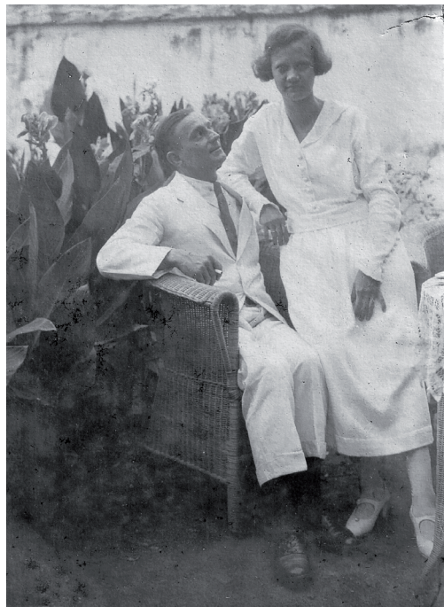
Mijn ouders in hun verlovingstijd