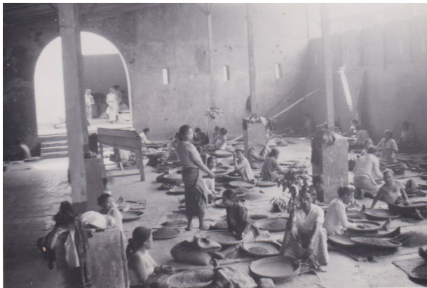
Tjoeroeg, de koffiefabriek: Vrouwen sorteren de koffiebonen.