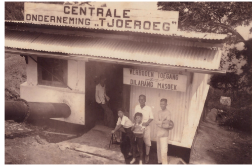
Turbinehuisje. Via de buis stort het water van de kali Bodri op de turbine, voor de opwekking van elektriciteit

Vanaf Semarang, de hoofdstad van de provincie Midden-Java, lopen twee hoofdwegen via Djokjakarta naar de zuidkust aan de Indische Oceaan. De onze gaat eerst westwaarts tot Weleri, via Kendal en Tjepiring, met de hoge witte schoorsteen van de suikerfabriek, daarna zuidwaarts, door de