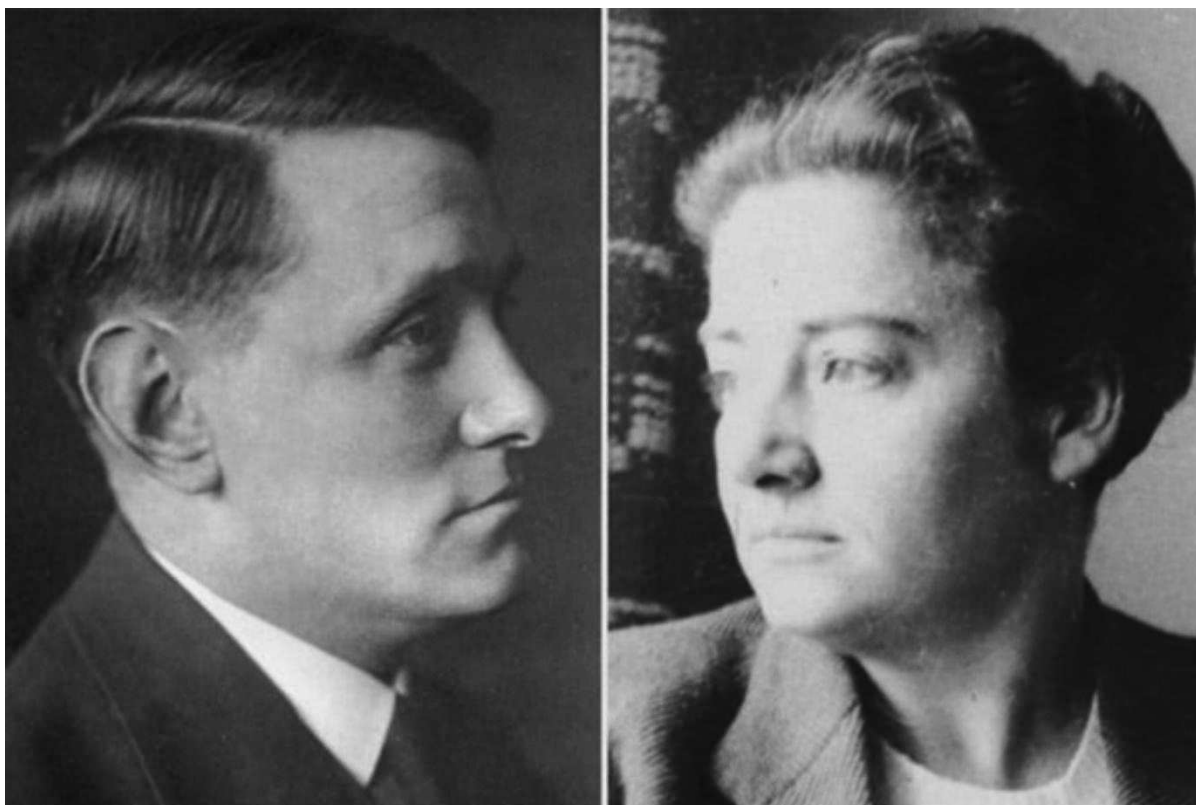
Willem Arondéus en Frieda Belinfante: Pride Month 8

Homoseksuelen speelden een actieve en cruciale rol in het verzet. Velen komen in opstand vanwege hun persoonlijke overtuigingen en ervaringen met onderdrukking, waarbij Willem Arondéus en Frieda Belinfante de bekendste zijn.