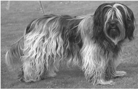
Afbeelding 1: Schapendoes

Een paar tellen later komt mevrouw via de berging naar buiten. "Kom maar mee, hij zit achter". Wij lopen via de berging mee naar de achtertuin. Daar zit een schapendoes. Man en een stel kinderen zijn ook aanwezig. Drukke bedoening.