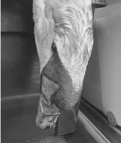
Afbeelding 3: Zwaan met vervormde snavel

met een beetje fochelen kan ik de zwaan in de bak laten zakken. Past precies alleen steekt de hals met de kop erbovenuit.