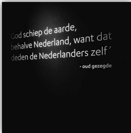
Afbeelding 1 Oud gezegde op de muur in het Boerhaave Museum Leiden