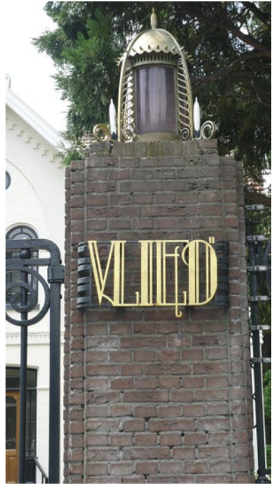
Pilaren van het toegangshek 1926- heden