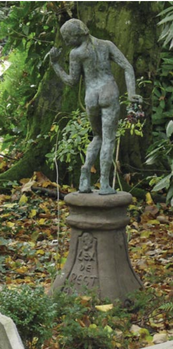
Grafsteen van Lex de Regt