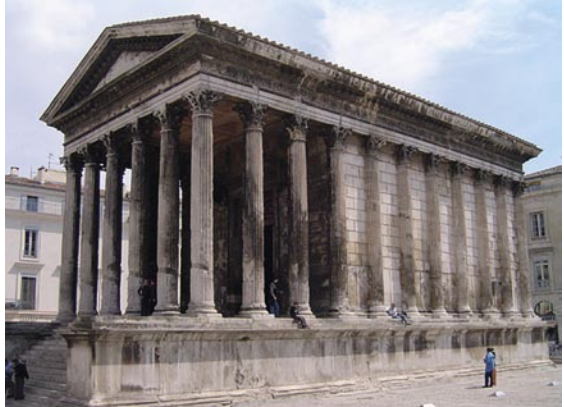
Romeinse tempel Maison Carrée

Het mausoleum is ontworpen door het architectenduo Jan van Rossem (1854-1918) en Willem Vuijk (1855-1918). Beide architecten ontwierpen in 1887 ook het Koninklijk Theater Carré aan de Amstel. Van Rossem en Vuijk gingen op originele wijze te werk door de naam van Carré te verbinden aan de beroemde Romeinse tempel Maison Carrée in het Franse Nîmes. Het resultaat was dat het mausoleum van Carré vrijwel een kopie is van het Maison Carrée. Het neoclassicistische mausoleum is geïnspireerd op de Romeinse bouwkunst en opgetrokken uit leisteen. De graftempel bevat grafsymboliek uit de Romeinse oudheid en het christendom. Romeinse tempels onderscheiden zich van Griekse tempels door een verhoging waarop het gebouw staat. Deze verhoging wordt aan de voorzijde onderbroken door een brede trap. De trap legt de nadruk op de voorgevel en maakt het onmogelijk het mausoleum van een andere zijde te betreden. Het hoofdstel, met driehoekig fronton, wordt