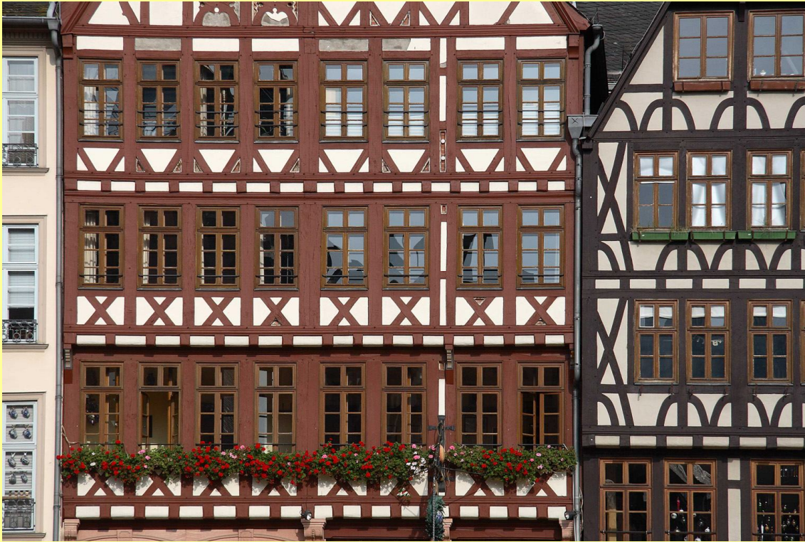
Römersberg, middeleeuwse panden (gereconstrueerd)