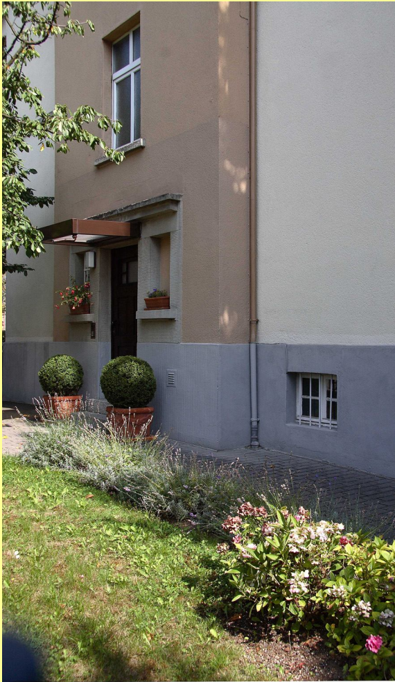
Marbachweg 307, woonhuis familie Frank