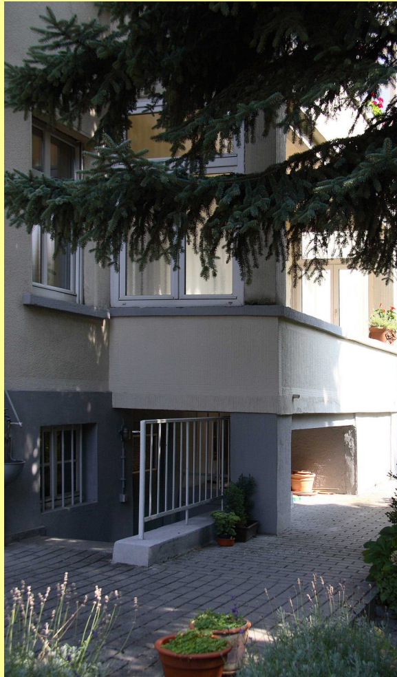
Marbachweg 307, woonhuis familie Frank