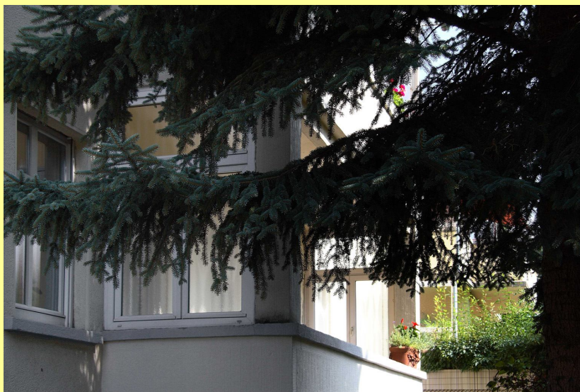
Marbachweg 307, woonhuis familie Frank

In de zomer zat de familie Frank graag op het balkon.