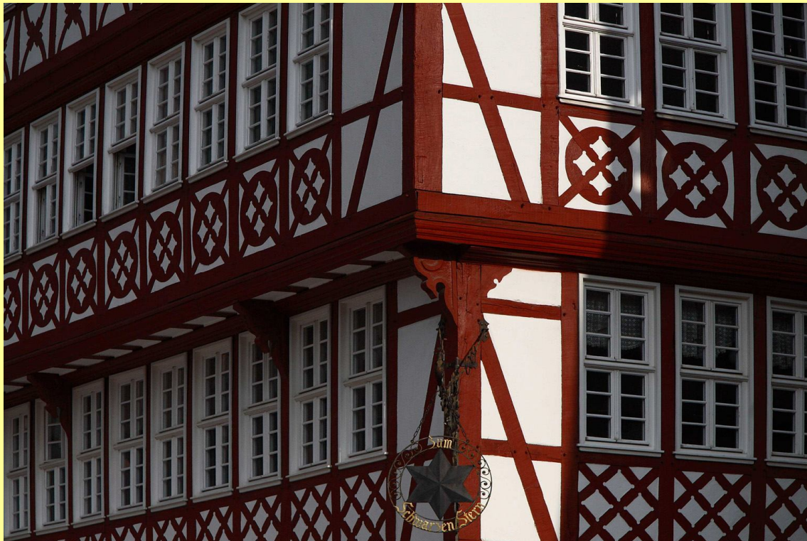
Römersberg, middeleeuwse panden (gereconstrueerd)