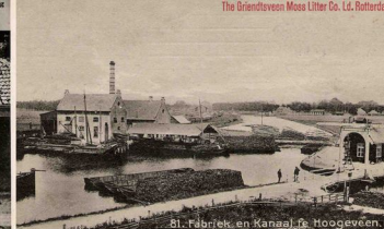
El-Fabriek en Kanal te Hoogveen