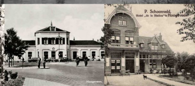
P. Schoonveld Huis en a. h. h. Hoogveen