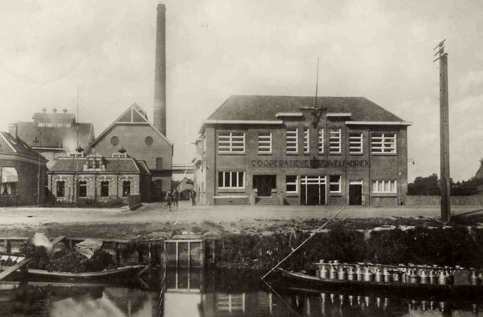
Coöperatieve Zuivelfabriek, Slootsche Opgaande. 1925