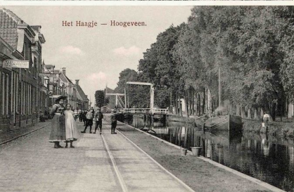
Het Haagje — Hoozevee.