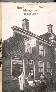
Groothandel in Spek en Vet Margarine Hoozevee