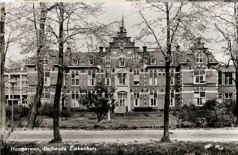
Hoogveen, Bethesda Ziekenhuis