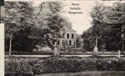
Huis Dijk (S) Hoogveen