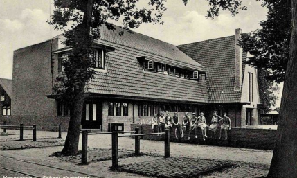
Hoogevener Industriële Club