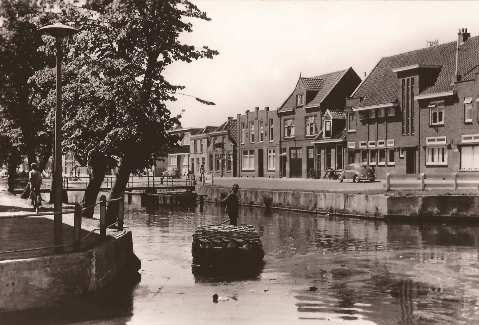
Pullenbok met melkbussen vaart richting de melkfabriek (Coöperatieve Zuivelfabriek). Op de Alteveerstraat staan twee Kevers geparkeerd. 1965