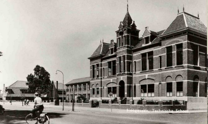
Hoogevener Industriële Club