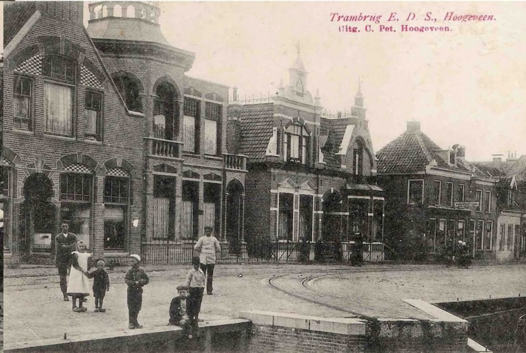
Trambrug E. D. S., Hoozevee.