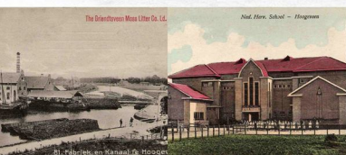
The Griensdveen Moss Litter Co. Ld.