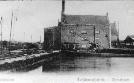
Tuifstrooieiselfabriek - Griensdveen