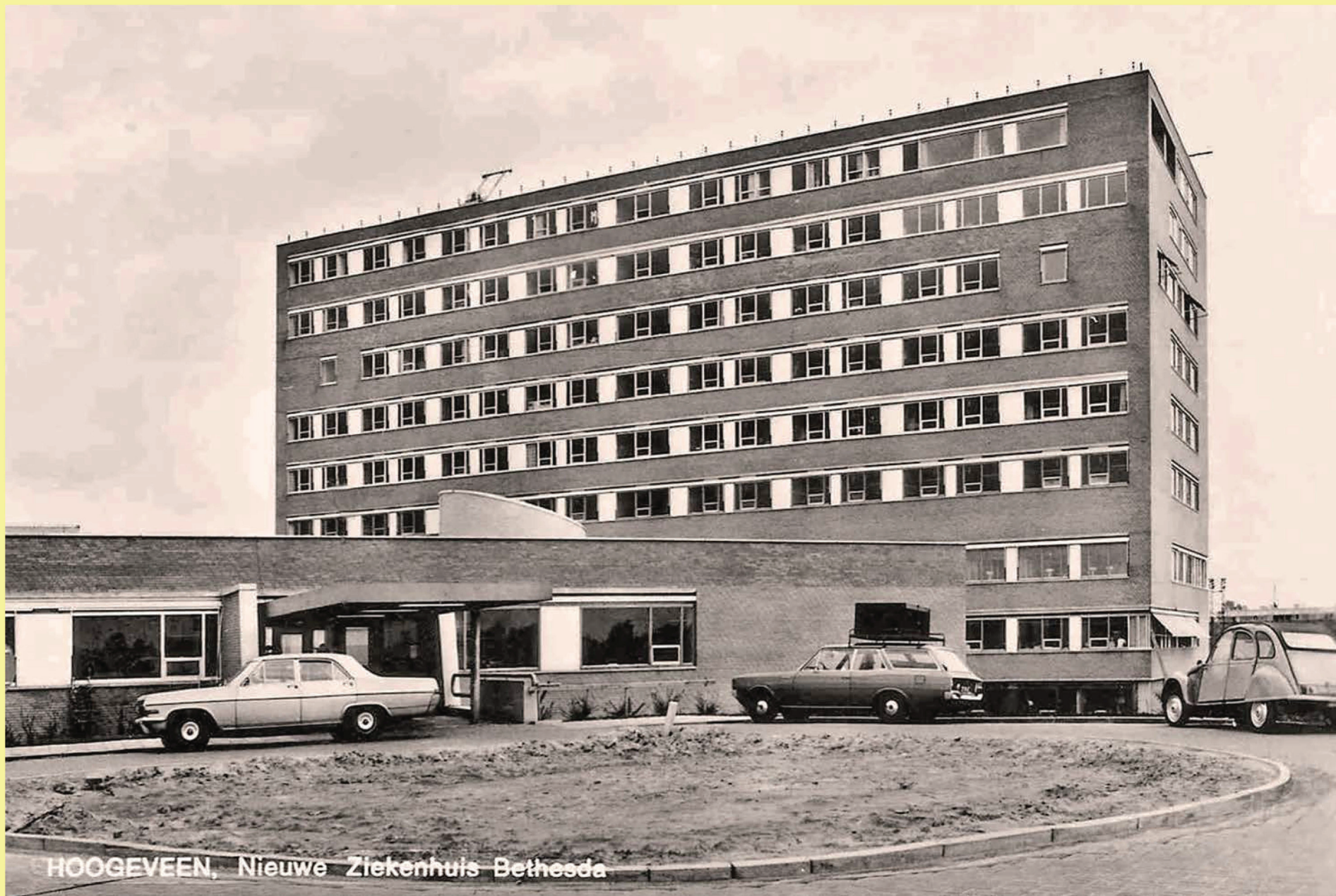
HOOGEVEEN, Nieuwe Ziekenhuis Bethesda