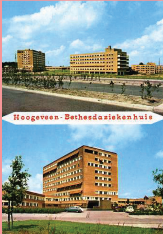
Ziekenhuis Bethesda (1970).

De bovenste foto van de ansichtkaart is genomen vanaf de Meester Harm Smeengelaan.