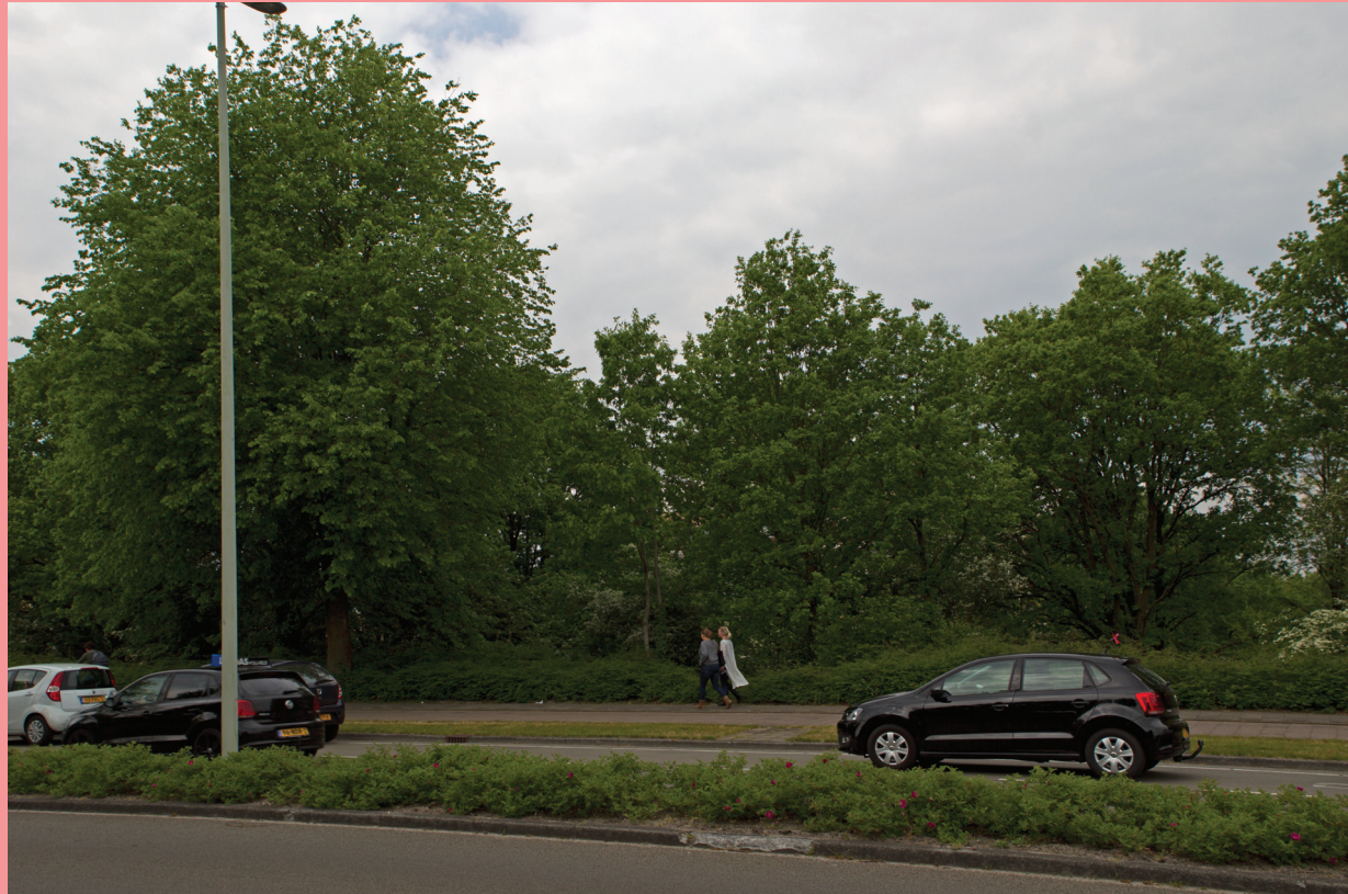
In 2016 heb ik vanuit hetzelfde perspectief een actuele foto gemaakt. Het uitzicht wordt belemmerd door struikgewas.

De bovenste foto van de ansichtkaart is genomen vanaf de Meester Harm Smeengelaan.