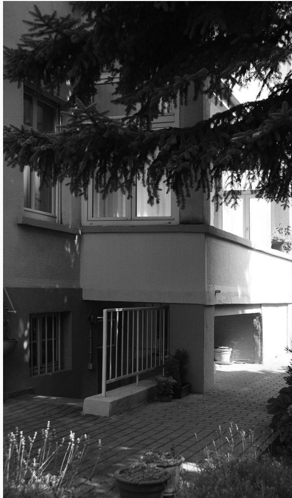
Marbachweg 307, woonhuis familie Frank