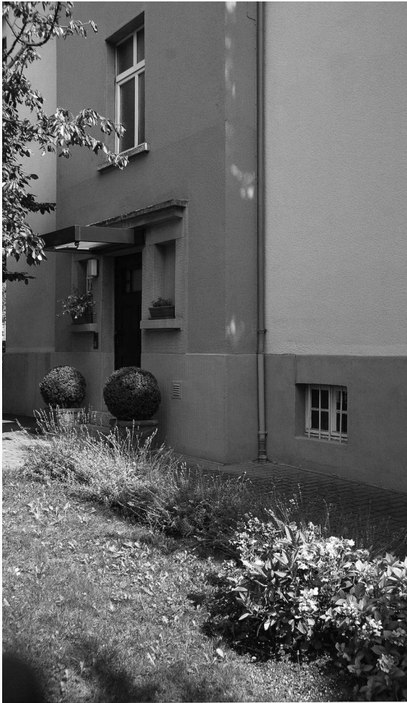
Marbachweg 307, woonhuis familie Frank