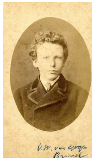
Vincent op 15-jarige leeftijd in Parijs, 1866

A= nummer op de betreffende plattegrond. B= coördinaten opnamepositie of object. C= paginanummer foto grootformaat historische foto. D= historische foto. E= opnamejaar historische foto. F= paginanummer foto grootformaat actuele foto. G= actuele foto. H= huidige adres.