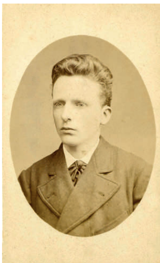
Theo van Gogh in 1876 op 19-jarige leeftijd

“ ‘t Is een mooie stad hier” , schreef Vincent. Zijn openhartige brieven aan zijn jongere broer Theo over de mensen in zijn omgeving, de gebouwen in de stad en de rijkdom van kunst vormen het uitgangspunt voor dit fotoboek. De fotograaf is op dezelfde plek gaan staan waar vroeger, vaak meer dan een eeuw geleden, iemand gegrepen werd door een bepaald gebouw of straat in Amsterdam.