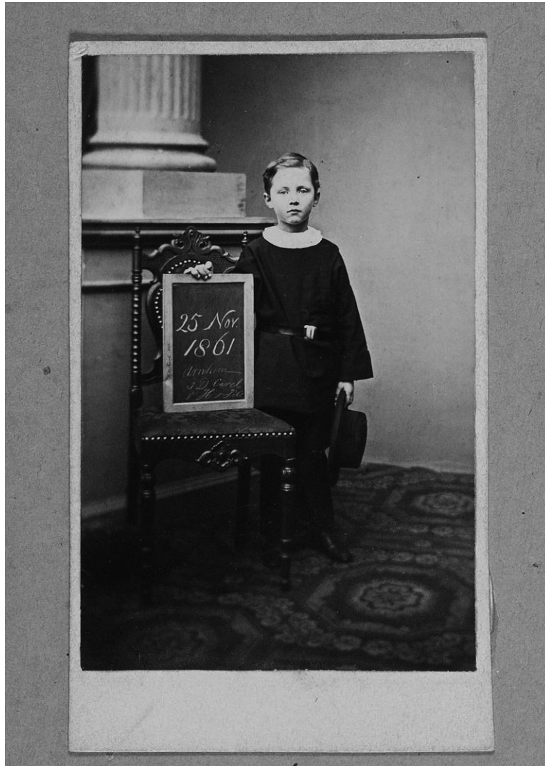
Beschrijving: portret van een onbekende jongen. Periode: 25 november 1861. Plaats: Arnhem. Nummer: 0894-1627-0564.

Niet alle foto's zijn terug te voeren op een fotograaf. Dat ligt ook aan de fotografen die op den duur hun negatieven vernietigden om de privacy van hun klanten te waarborgen of om magazijnruimte vrij te maken. Soms nam een fotograaf de zaak van een andere fotograaf over inclusief de lopende bestellingen, maar veel fotografen zullen uiteindelijk hun voorraad hebben opgeruimd als ze stopten met werken. Weinigen zullen zich bewust zijn geweest van de latere waarde van hun foto's. Uitgeverijen hechtten veelal ook niet veel waarde aan naamsvermelding van de fotograaf. Gelukkig kunnen we tegenwoordig nog genieten van een aantal foto's en prentbriefkaarten van de eerste fotografen in Arnhem.