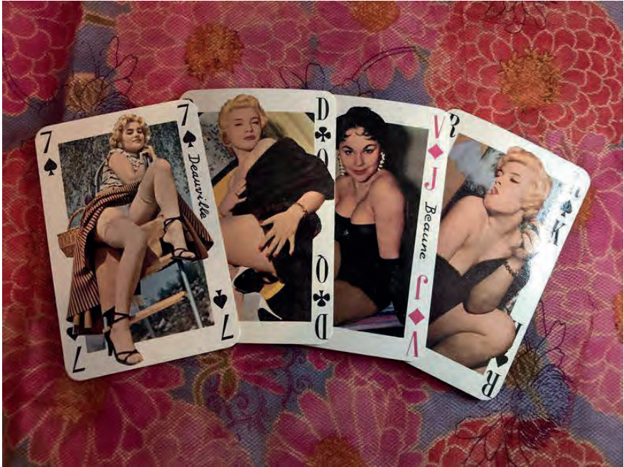
Franse Speelkaarten met pin-up meisjes, circa 1965