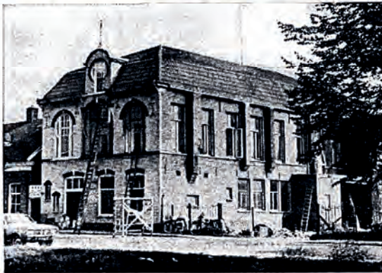
Het gebouw „Irene" aan de Schutstraat in Hoogeveen, binnen de muren waarvan een sexblad wordt gemaakt.