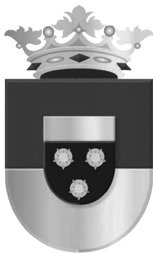
Wapen van Ruinen

Ik wens de kijker veel kijkplezier en hoopt dat dit boekje althans een bescheiden bijdrage levert aan het behoud van het nog resterende erfgoed in Ruinen, dat herinnert aan de boeiende geschiedenis van dit dorp. Zodat ook komende generaties hiervan nog kunnen genieten.