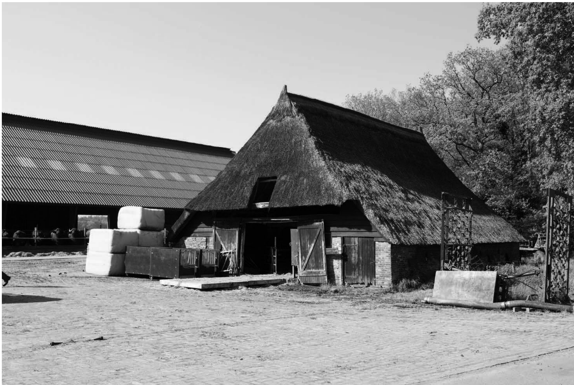
Beschrijving: Schuur Buffelboerderij Luth (Kraloërweg 9, Eursinge).