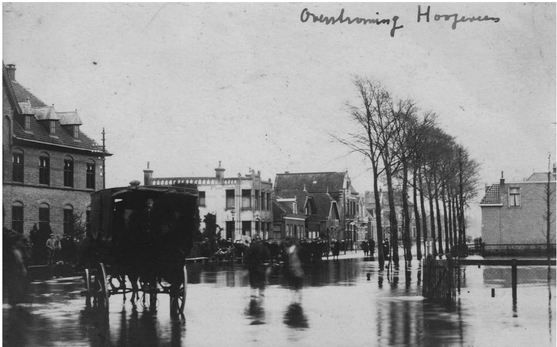
1918. Prentbriefkaart. Hoogwater. Links in beeld het Karmelietenklooster. Dirk Zomer