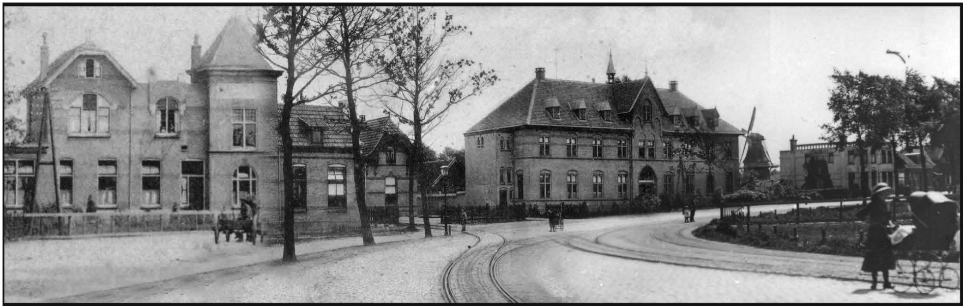
Creatie van Andy Benjamins

In het gezondheidscentrum worden veel activiteiten georganiseerd, zoals kinderactiviteiten, vergaderingen, conferenties, lezingen en cursussen. Het theater heet De Kubus en heeft 90 stoelen die gemonteerd zijn op een inklapbare tribune. De Kubus is ook bestemd voor presentaties en vergaderen. De ruimte is uitgerust met professioneel licht en geluid, groot presentatiescherm en livestream (rechtstreekse uitzendingen). De Kubus kan ook worden ingericht voor ondermeer lezingen, diploma-uitreikingen, colleges, musicals, film-, zang-, dans- en muziekvoorstellingen en bedrijfspresentaties.