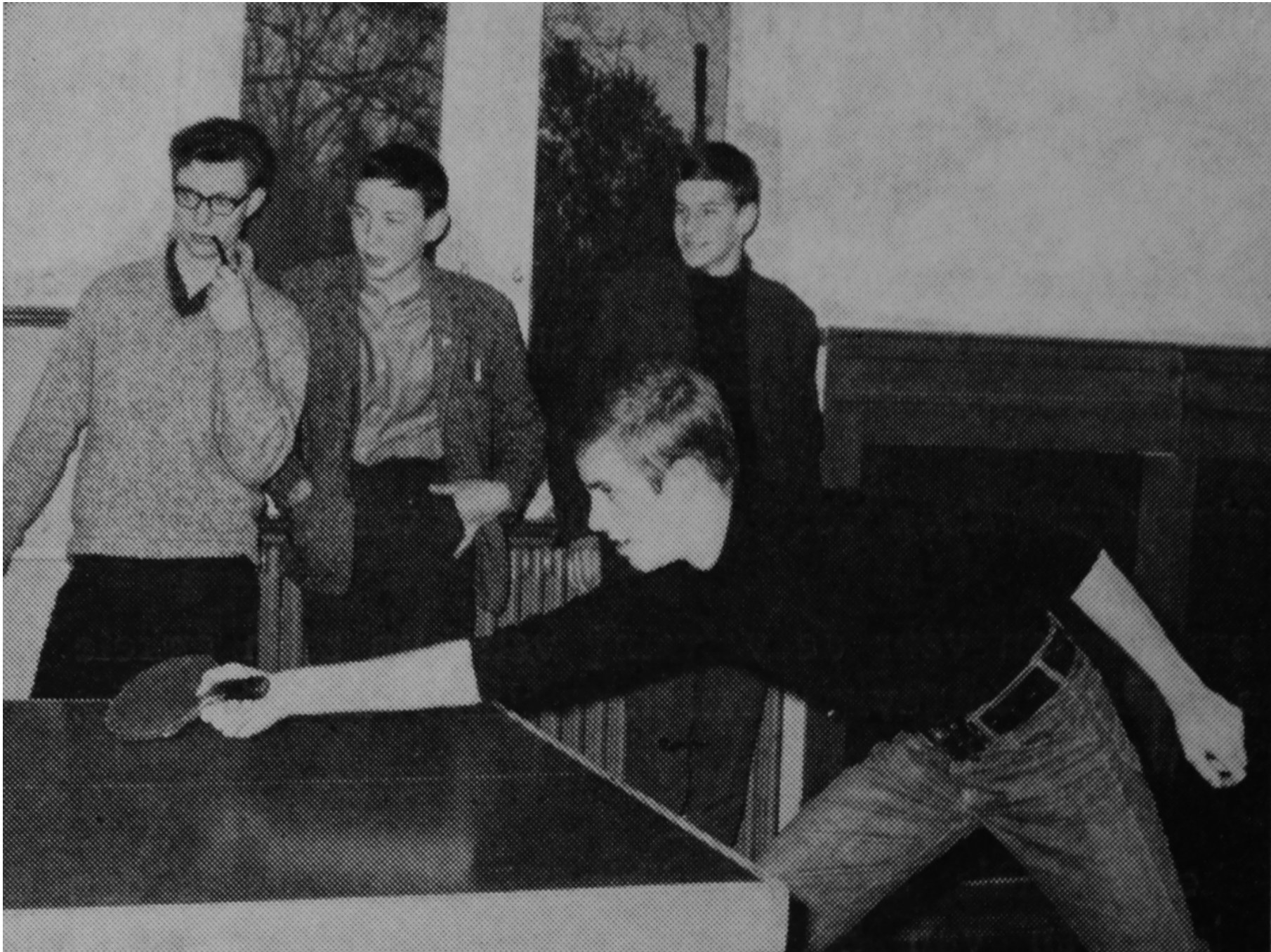
1968. Ontspanningsruimte Beekman Ockels. Met pijprokende jongeman.