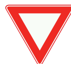
Verleen voorrang aan bestuurders op de kruisende weg