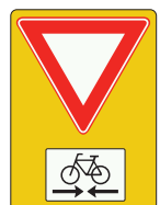
Verleen voorrang aan fietsers (in 2 richtingen) op de kruisende weg