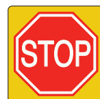
Stop en verleen voorrang aan bestuurders op de kruisende weg