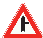
Voorrangskruispunt; Zijweg rechts